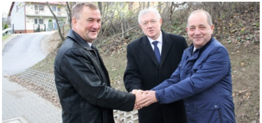
Deklaracja w sprawie budowy chodników

Wójt zapewnił także wiceministra Wiesława Janczyka, że gmina ma już przygotowane projekty budowlane na kolejne etapy budowy chodników przy drodze powiatowej w Rdziostowie i Chełmcu i jeżeli tylko powiat nowosądecki ujmie te inwestycje w swoim budżecie, to gmina natychmiast dołoży 50% do inwestycji. Wójt zadeklarował również, że dołoży 50% do każdego chodnika przy drodze powiatowej, jeżeli taki znajdzie się w budżecie starostwa powiatowego. A.B.