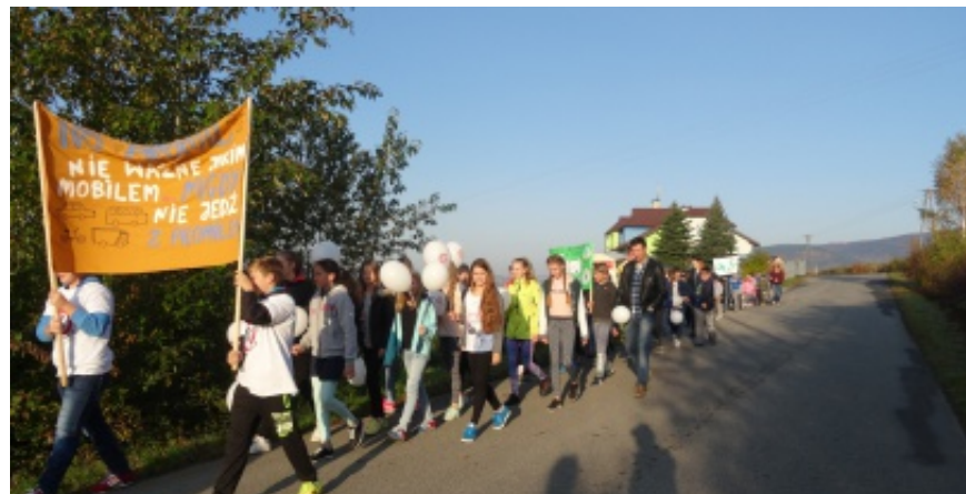
X edycja No Promil.