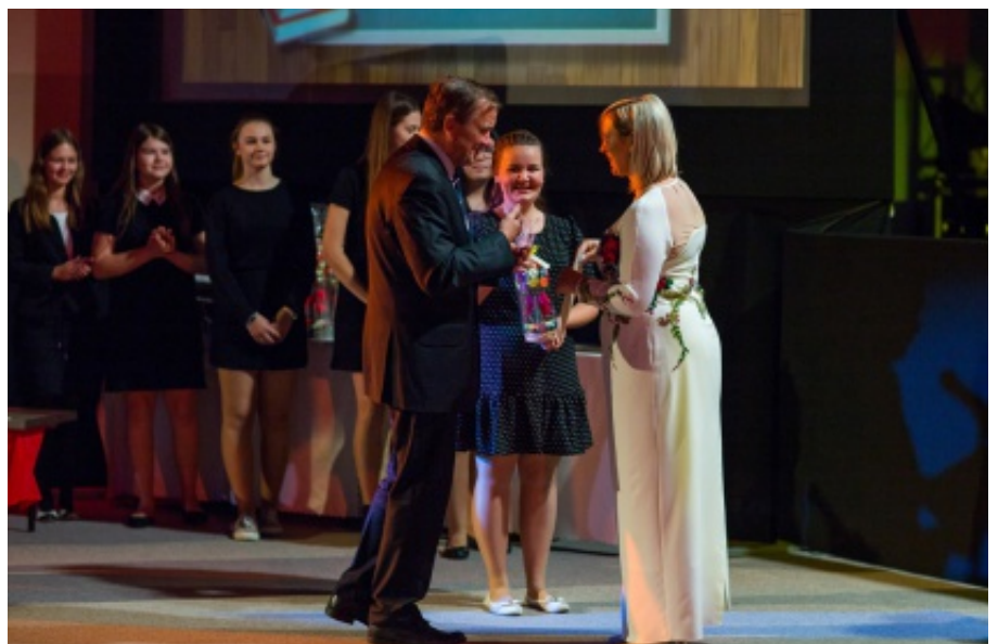
Dzień Edukacji Narodowej w Świniarsku.