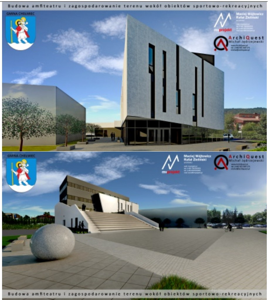
Wizualizacja obiektu Rynek 1