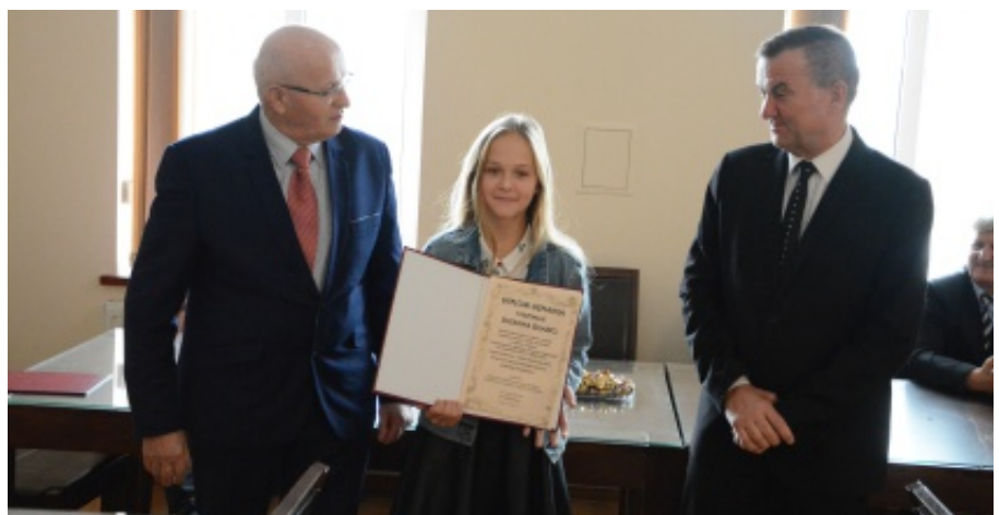
Rozdanie nagród w dziedzinie kultury i sportu