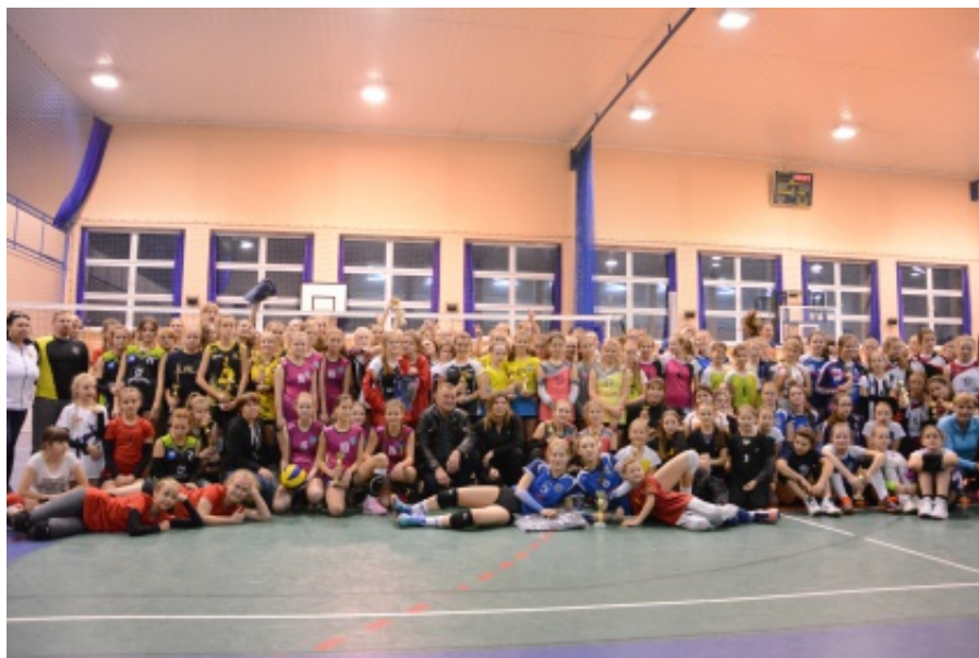
I Turniej Piłki Siatkowej o Puchar Wójta Gminy Chełmiec