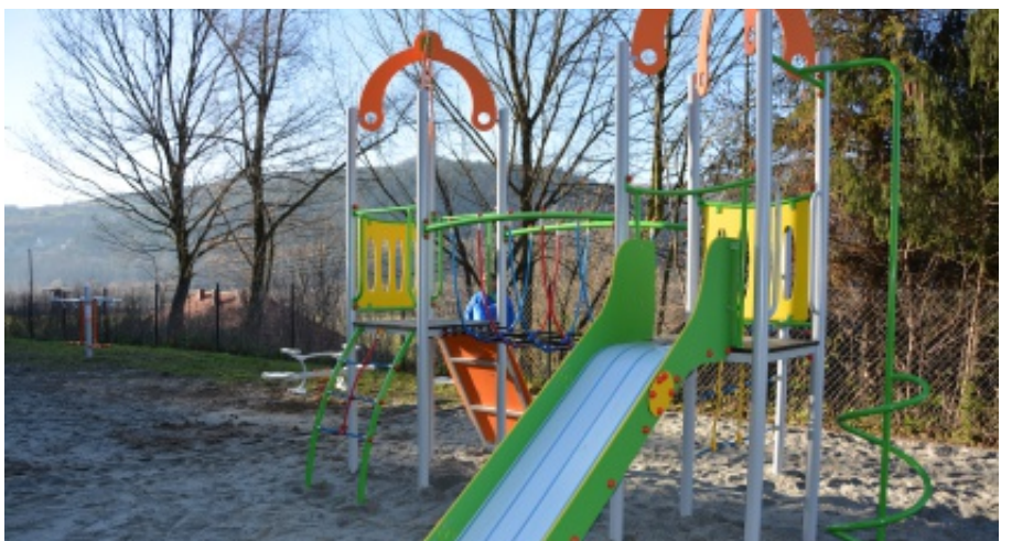
Nowy plac zabaw w Kurowie.

Koszt całkowity projektu wyniósł 631 087,66 zł w tym wysokość dofinansowania to 356 442,68 zł. M.B.