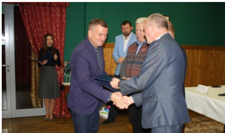
Odebranie umów na wymianę piców w gminie Chełmiec

lifikowane do projektu będzie mogło zyskać do 8 000 zł dofinansowania do zakupu i montażu kotła oraz dodatkowe środki na modernizację centralnego ogrzewania. Pierwsze umowy z mieszkańcami są już podpisane. M.B.