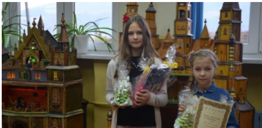
Gminny Konkurs Bożonarodzeniowy

Wszystkim uczestnikom wręczono dyplomy i upominki – słodkie choinki przygotowane przez niezawodne Panie z Rady Rodziców z Krasnego Potockiego.