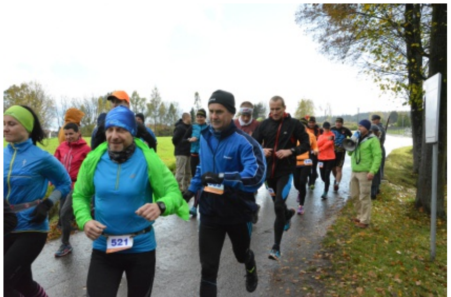
XXV Bieg Legionisty