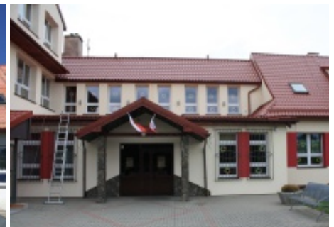
Szkola Podstawowa w Świniarsku przed i po remoncie – koszt robót budowlanych to 727 184, 60 zł