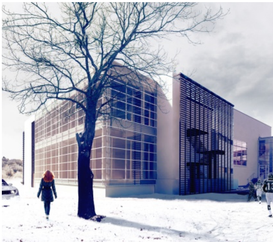
Wizualizacja basenu po rozbudowie

- za kwotę blisko 2,5 mln zł realizowana jest przebudowa dróg gminnych wraz z chodnikami w m. Chełmec i Paszyn