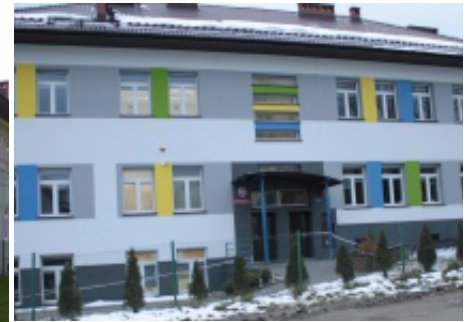
Szkola w Paszynie przed i po remoncie – koszt robót budowlanych to 411 385,86 zł