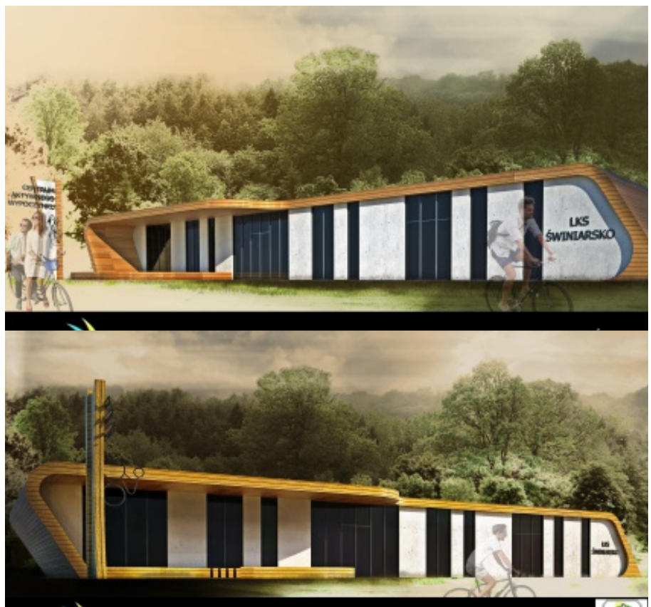
Wizualizacja Centrum Wypoczynku w Świniarsku