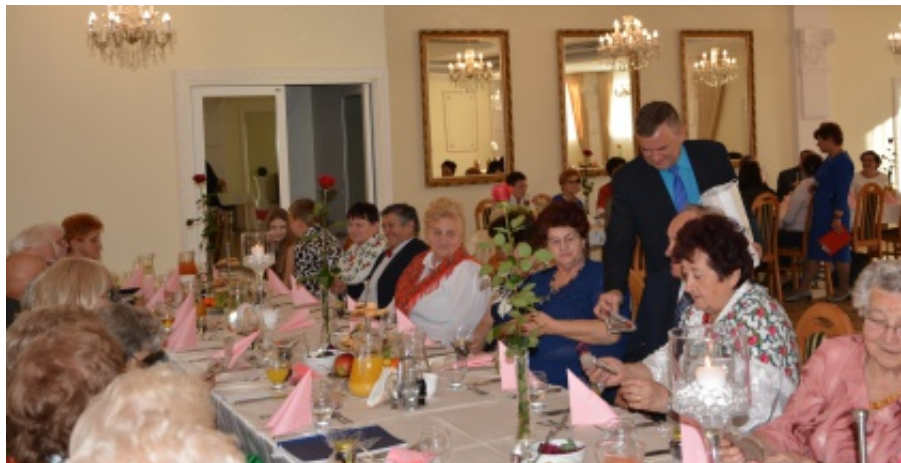
X-lecie powstania Chełmieckiego Klubu Seniora