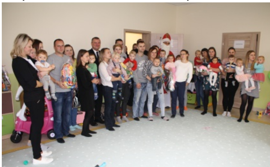
Otwarcie żłobka w Biczycach Dolnych

będą zwolnieni z opłat. Opiekę nad dziećmi sprawuje wykwalifikowana kadra. Maluchom zapewniono codzienne wyżywienie. Pozyskane środki z UE pozwoliły na zakup zabawek i materiałów dydaktycznych oraz odpowiedniego wyposażenia, co umożliwi prowadzenie zajęć opiekuńczo-wychowawczych i edukacyjnych zgodnie ze standardami jakości opieki i wspierania rozwoju dzieci do lat 3.R.W.