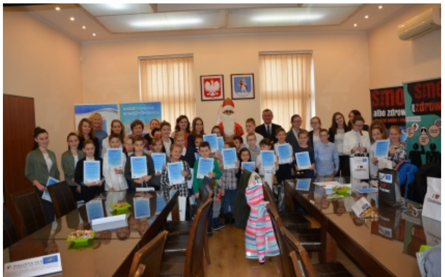
Nasze powietrze w naszych rękach

Wszystkim zwycięzcom serdecznie gratulujemy i życzymy dalszych sukcesów we wspólnej trosce o czyste powietrze. M.B.