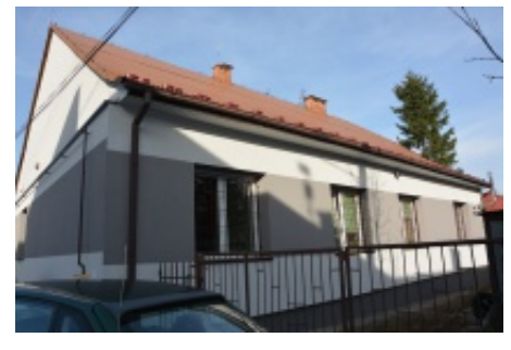
Gminny Ośrodek Pomocy Społecznej przed i po remoncie