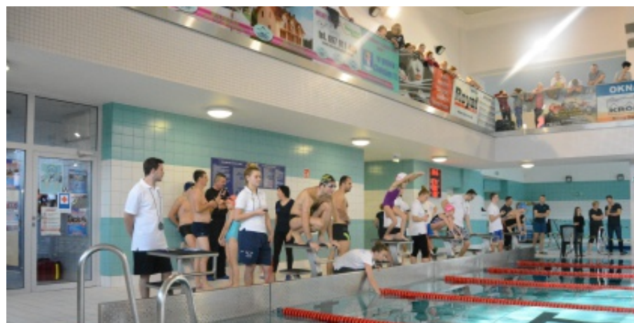
I Zawody Pływackie o Puchar Wójta Gminy Chełmiec

W zawodach brało udział ok. 250 zawodników od najmłodszych 6 latków po rodziców i ich dziadków. Aqua Centrum Chełmiec wypełniony został niezwykle rodzinną atmosferą i zaciętą zdrową rywalizacją w sztafetach rodzinnych. Wszyscy zawodnicy otrzymali dyplomy