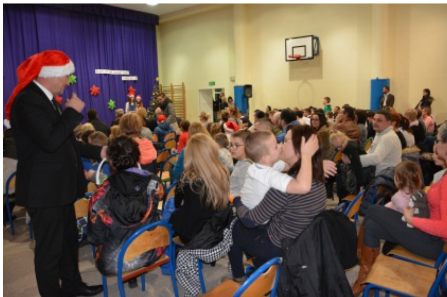
Mikołajki w Chełmcu