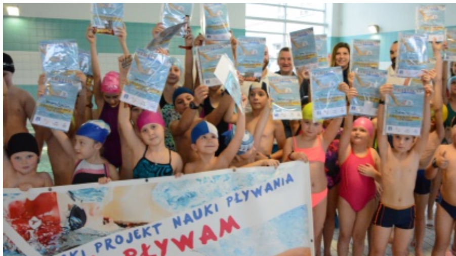
Zakończenie projektu Już Pływam

wych klas I -VI, z terenu gminy Chełmiec, którzy w I Edycji od 3 kwietnia do 17 czerwca, II Edycji od 21 września do 18 listopada br. uczęszczali na intensywne zajęcia z instruktorami na pływalni AQUA CENTRUM CHEŁMIEC. E. Z.