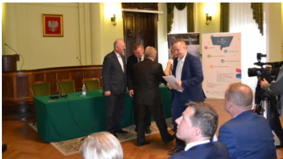
Odebranie umowy na budowę przedszkola w Paszynie

wych: rytmika, taniec, plastyka, gimnastyka korekcyjna, hipoterapia, dogoterapia oraz z specjalistycznej porady logopedy i psychologa. Z środków projektu planuje się także w pełni wyposażać 2 oddziały przedszkolne oraz zakupić sprzęt multimedialny, pomoce dydaktyczne i zabawki. M.B.