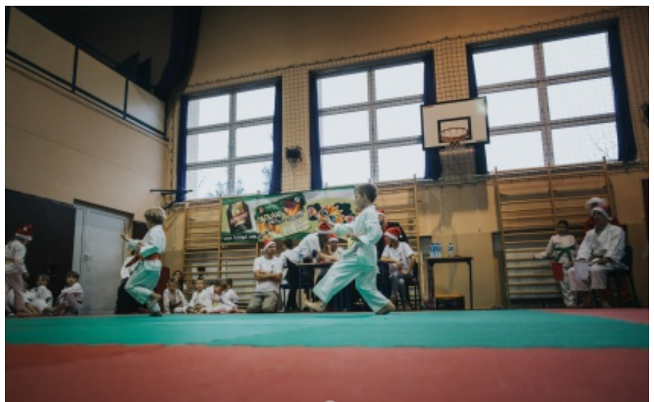
Mikołajkowy Turniej Karate.

Turniej został objęty patronatem wójta gminy Chełmiec, który ufundował puchary, medale i nagrody dla uczestników. Odbyła się również zbiórka chary-