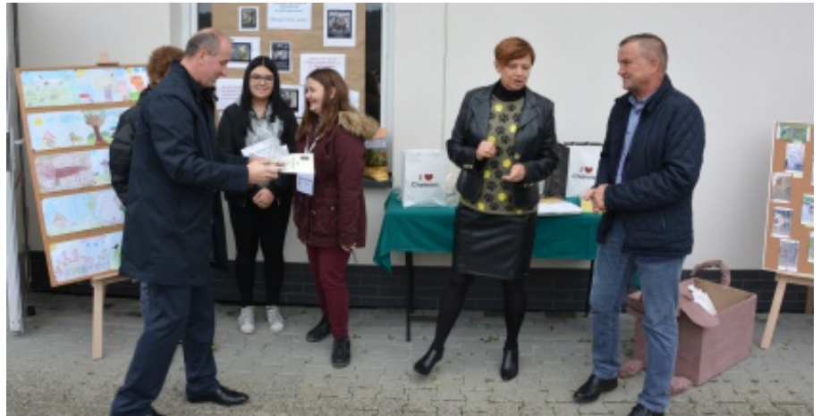
Dwa lata Gminnego Schroniska dla Zwierząt