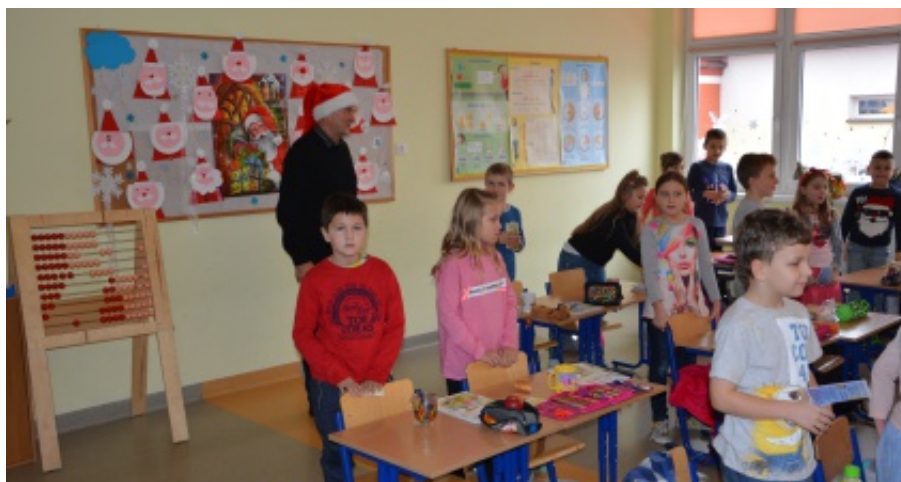
Prezent mikołajkowy dla wszystkich uczniów z gminy Chełmiec