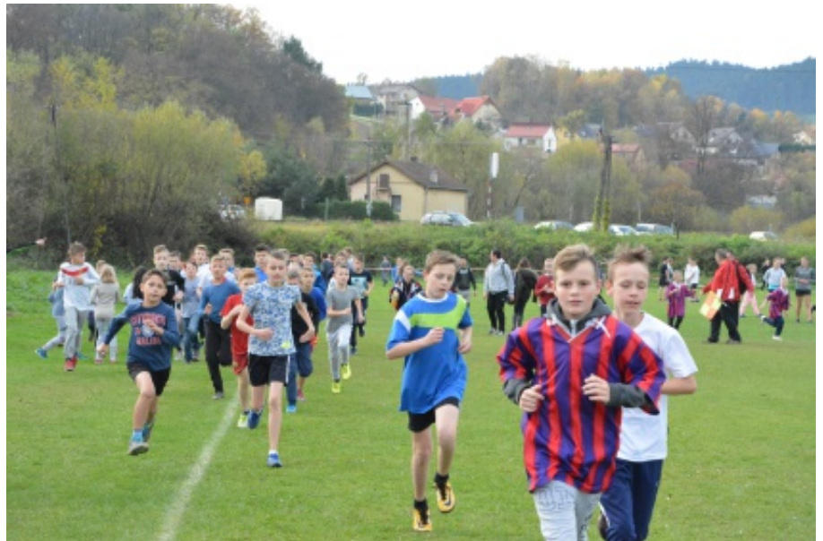
XXV Bieg Legionisty