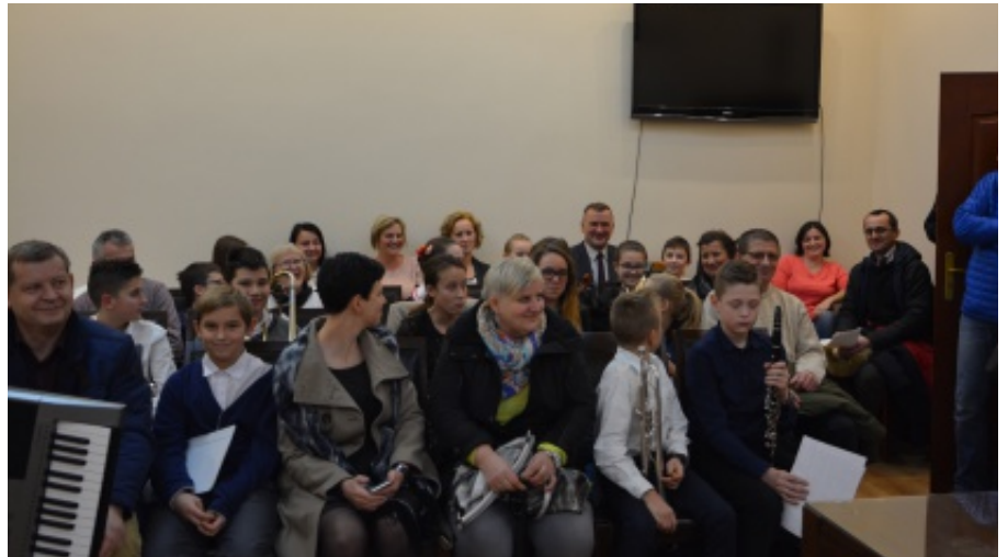
II Gminny Przegląd Młodych Muzyków Instrumentalistów