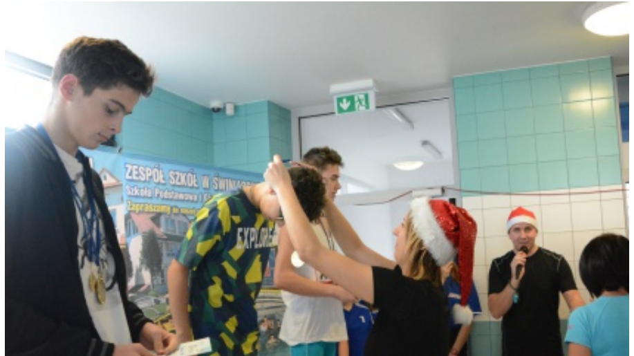
Mikołajkowe Zawody Pływackie