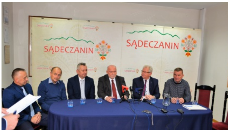
Podpisanie umowy dotacji

Wartość projektu przypadająca na gminę Chełmiec to 813 tys. zł., z czego dotacja unijna to 430 tys. zł. M.B.