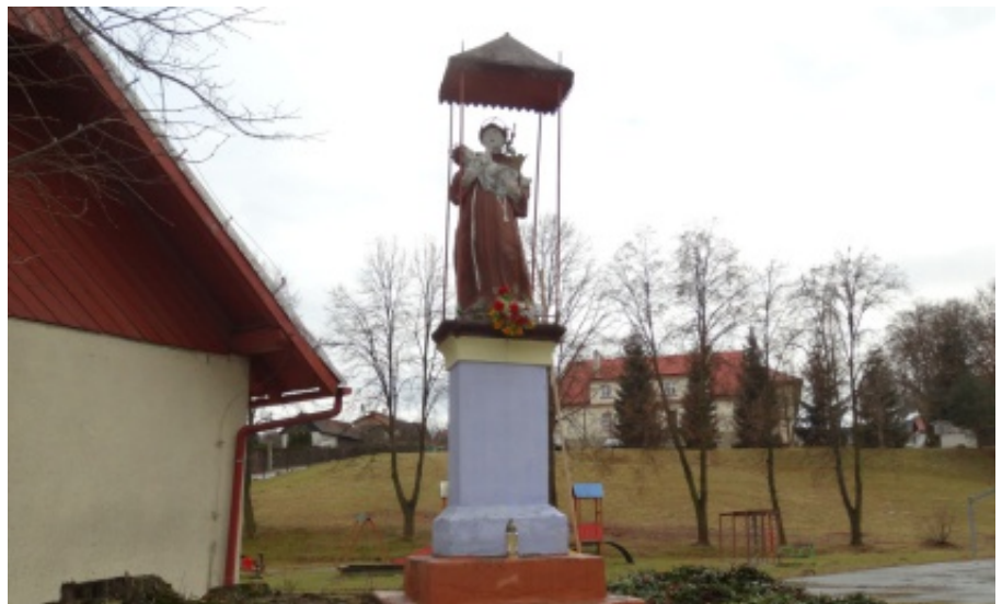
Odnowiona kapliczka w Marcinkowicach