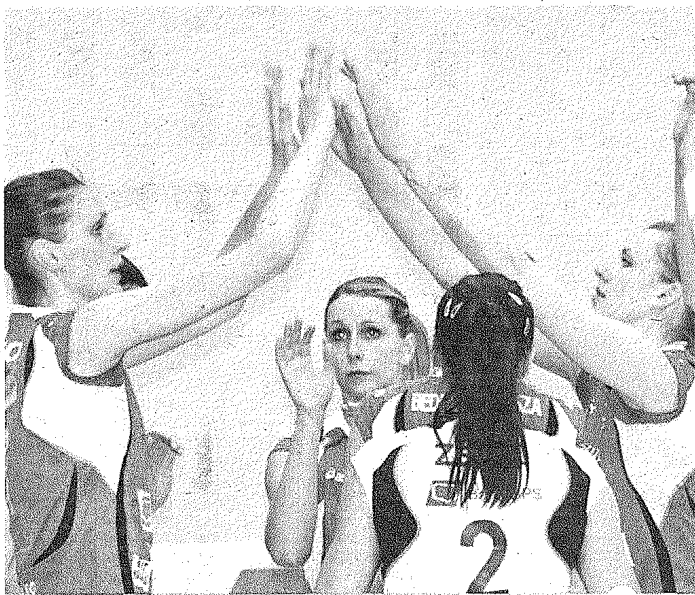
Siatkarki z Muszyny na tym etapie rozgrywek nie musiały specjalnie natrudzić się na parkie.

Mecz Banku BPS Muszynianki Fakro Muszyna z Organiką Budowlanymi Łódź dzisiaj o godzinie 18. Spotkanie poprowadzą Piotr Skowroński i Krzysztof Żygoński.