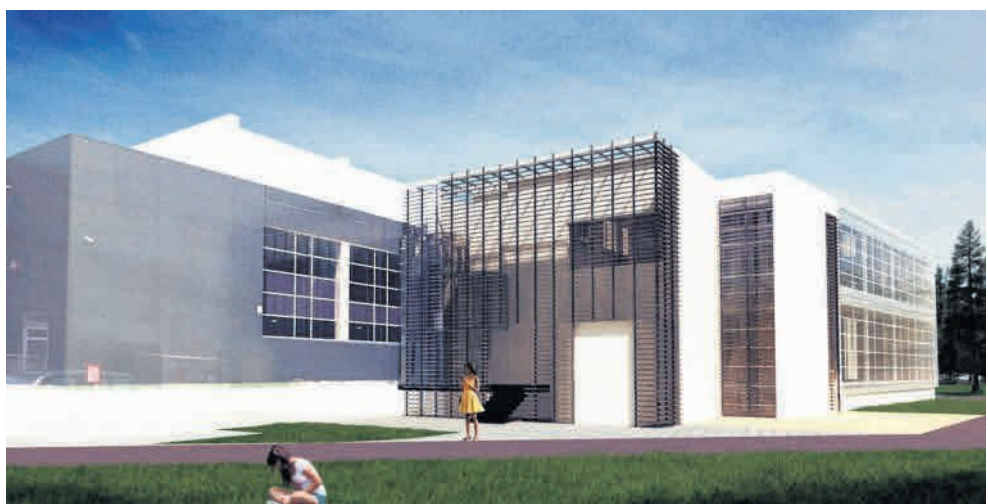
► Tak będzie wyglądała nowa część Aqua Centrum w Chełmcu, która ma być gotowa w 2018 roku

- Zdarzały się też i takie dni, że z naszego centrum korzystało dziennie nawet tysiąc osób -