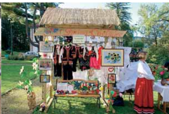
Wyroby rękodziela ludowego