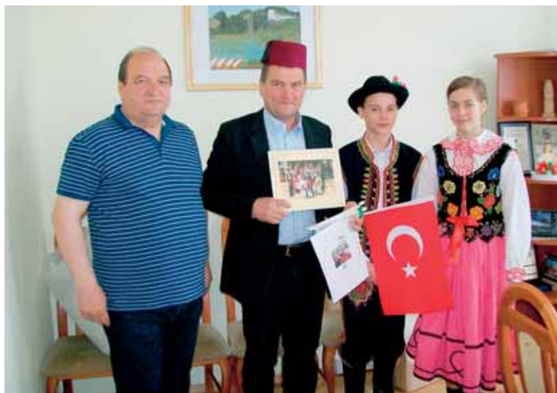
Delegacja Zespołu Pieśni i Tańca Świniarsko u wójta