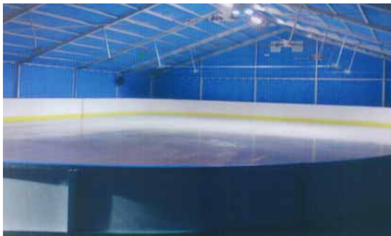
Tak będzie wyglądało nowoczesne lodowisko/rolkowisko w Chełmcu

• poprawę gospodarki wodno-ściekowej na terenie Gminy Chełmec poprzez rozbudowę kanalizacji sanitarnej w Piątkowej, Biczycach Górnych i Dolnych oraz budowę sieci wodociągowej w Kłęczanach, Paszynie, Piątkowej i Boguszowej, z wykorzystaniem dofinansowania z PROW - podstawowe usługi dla ludności wiejskiej, wartość projektu 7 mln złotych.