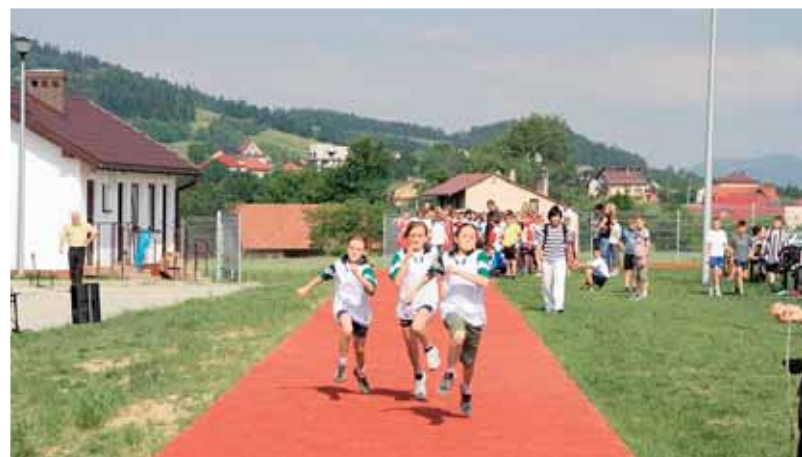
Zawody LA klas IV o mistrzostwo gminy Chełmec w Trzetrzewinie