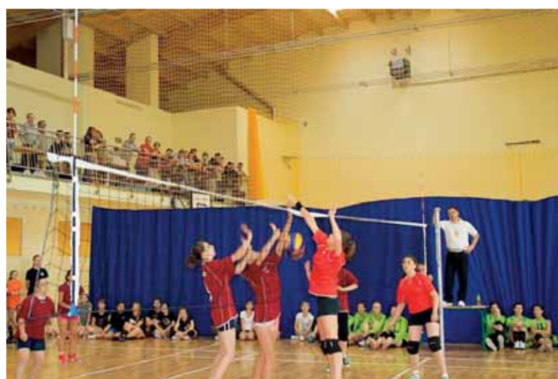
Turniej Zaserwuj Zdrowy Tryb Życia w Piątkowej