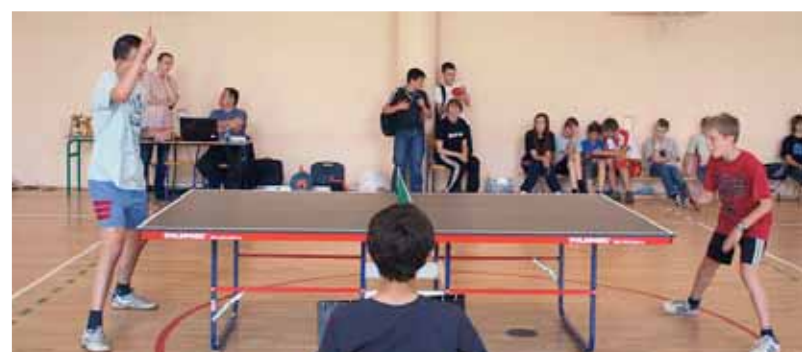
Turniej tenisa stołowego gimnazjów Nie-Nałogom w Paszynie