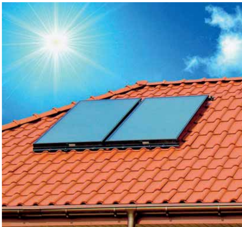
Słońce jest niewyczerpalnym źródłem energii. Warto o tym pomyśleć i wykorzystać szansę, jaką stwarzają władze gminy