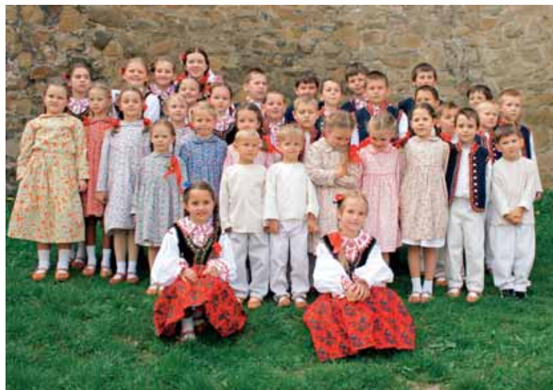
Dzieci Zespół Regionalny Mała Helenka