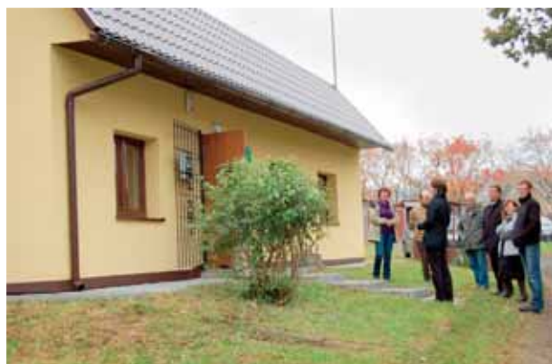
Otwarcie wyremontowanej świetlicy w Wielopolu

– Zabawa Mikołajkowa dla dzieci z terenu gminy Chełmec. Miejsce: Wielogłówna