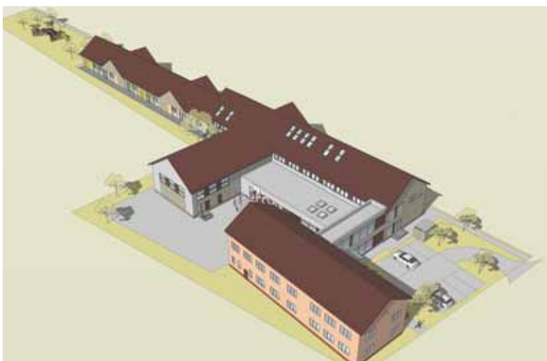
Wizualizacja Szkoły Podstawowej w Biczycach Dolnych Dolnych

Zapoczątkowany w latach poprzednich dynamiczny rozwój gminy Chełmec jest kontynuowany również w 2011 roku i w latach następnych. Najważniejsze realizowane inwestycje: