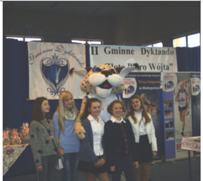
II Gminne Dyktando.