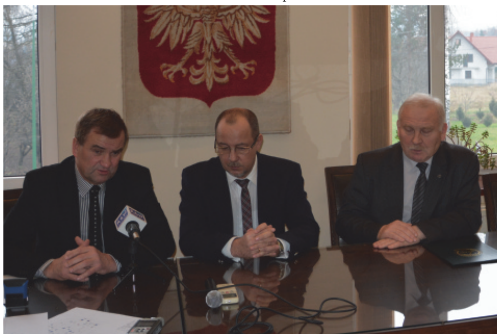
Podpisanie umowy na miasteczko ruchu drogowego w Chełmcu.

Według kosztorysu inwestorskiego koszt budowy miasteczka to 574 tys zł z czego 50% pokryje budżet gminy Chełmiec, a 50% MORD w Nowym Sączu. Przetarg zostanie ogłoszony jeszcze w grudniu 2014 roku, natomiast zakończenie budowy planuje się na czerwiec 2015 roku, tak aby jeszcze w okresie wakacyjnym można było skorzystać z miasteczka.