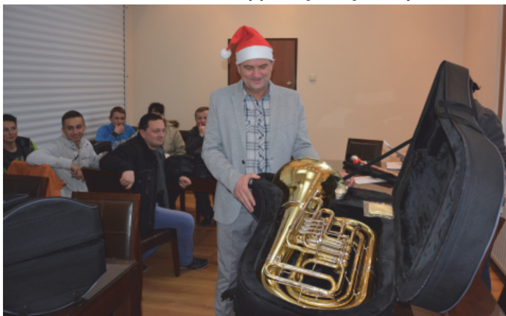
Przekazanie instrumentów dla szkółki muzykowania.

nerstwie z Gminą Chełmieć, która zapewni nieodpłatnie sale na koncerty, które odbędą się w Paszynie, Grybowie, Kamionce Wielkiej, w Chełmcu, Małej Wsi oraz w Świniarsku. Wszystkich zainteresowanych twórczością młodych muzyków z Paszyna serdecznie zapraszamy.