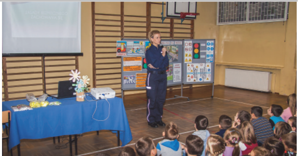
Spotkanie z funkcjonariuszem KMP w Nowym Sączu.

czonemu zaufania w stosunku do nieznanymi osob. Uczniowie klas 4-6 zostali zapoznani z tematem „Nastolatki a prawo”. Zorganizowane spotkanie bylo jednym z wielu dzialan realizowanych w naszej szkole w ramach Projektu Zintegrowanej Polityki Bezpieczenstwa.