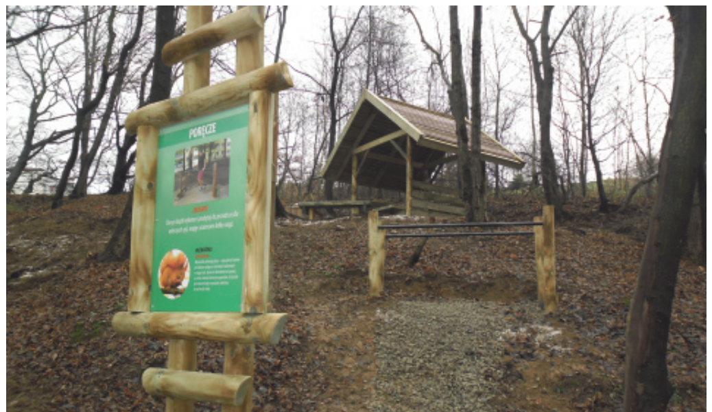
Ścieżka dydaktyczno-rekreacyjna w Biczycach Górnych.

Poniżej zdjęcia elementów które zostały zamontowane na trasie leśnej ścieżki.