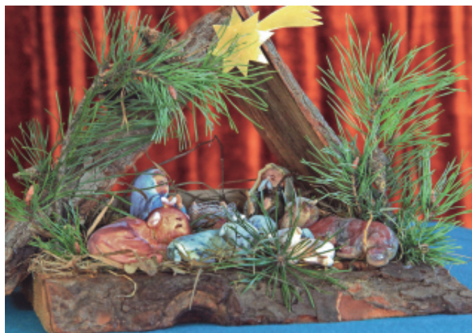
II miejsce - Kółko Plastyczne WDK w Mystkowie, gm. Kamionka Wielka