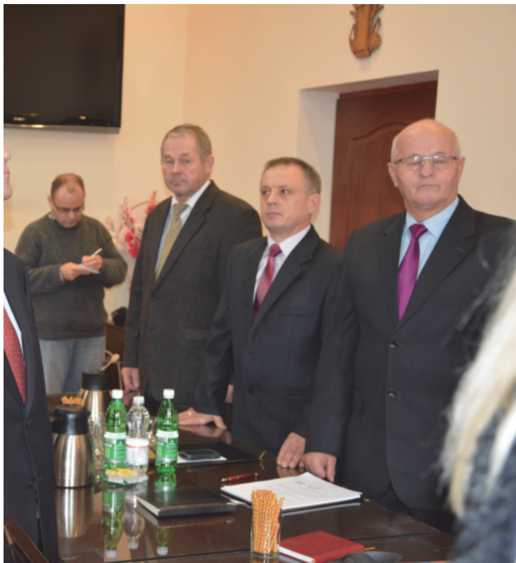
I sesja Rady Gminy Chełmiec.