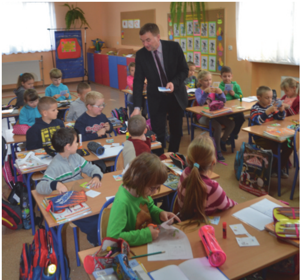
Wójt wręczył karnety na lodowisko uczniom ze szkół w Chełmcu.

Pozostałe karnety w ilości 3759 przekazane zostały dyrektorom szkół celem wręczenia wszystkim uczniom przez wychowawców poszczególnych klas.