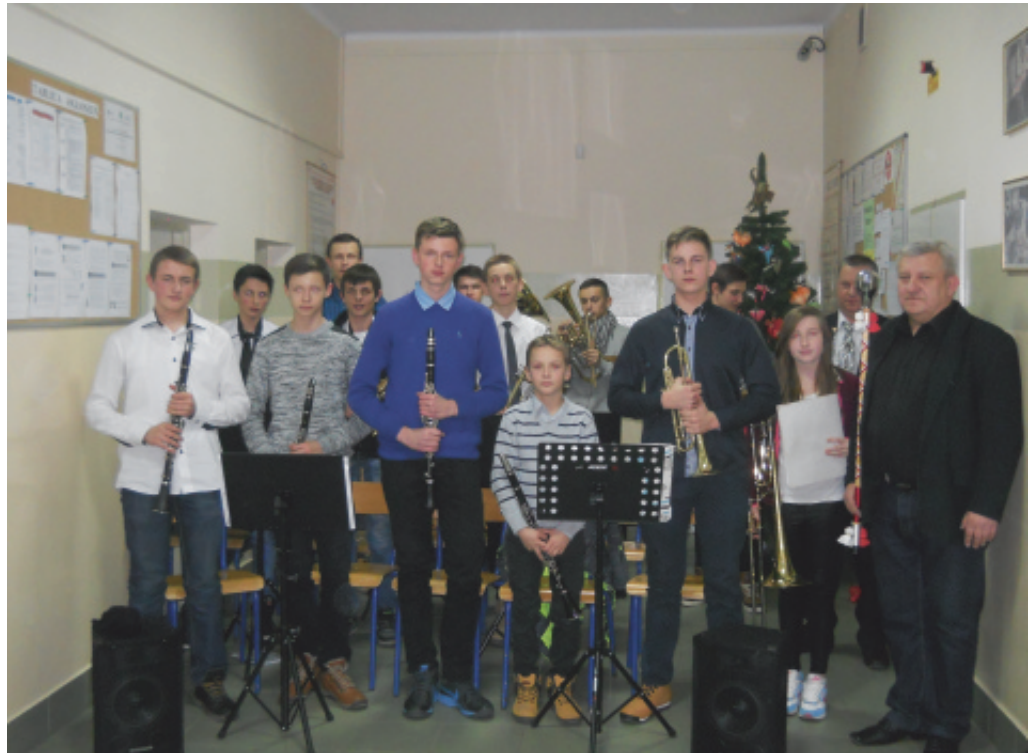
Paszyńskie spotkania z muzyką.