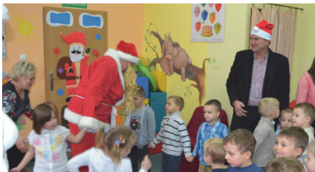
Mikołaj w przedszkolu.

5. Oddziały specjalne w Chełmcu prowadzi Zespół Szkół w Chełmcu. Do oddziałów specjalnych uczęszcza 12 dzieci.