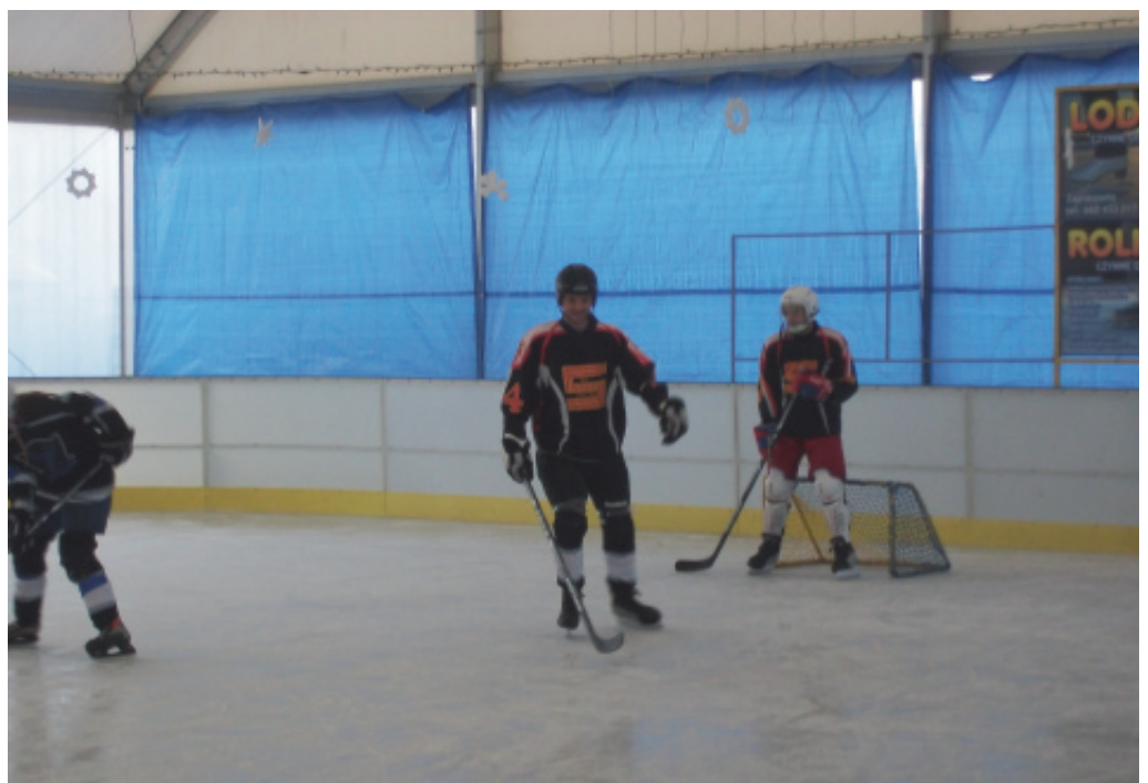
Lodowisko w Chełmcu.

Zatem lodowisko czeka na łyżwiarzy przez 7 dni w tygodniu