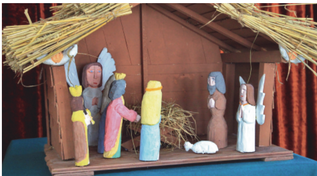
I miejsce - Konrad Poręba z ZS w Mystkowie, gm. Kamionka Wielka