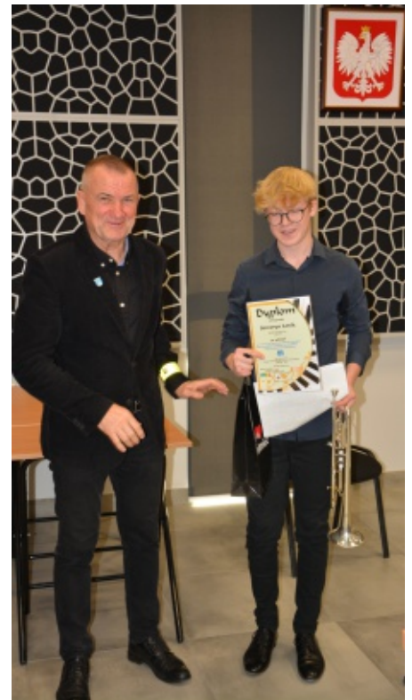
VI Konkurs Młodych Muzyków