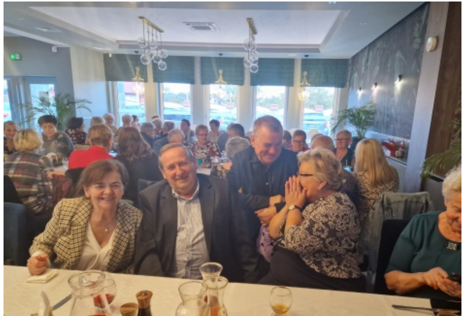
Dzień Osób Starszych w Gminie Chełmec