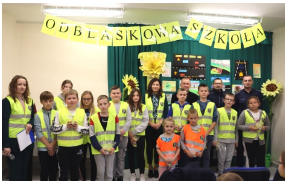
Podsumowanie akcji "Odblaskowa Szkoła"

Podczas uroczystości koordynatorki akcji podsumowały dwumiesięczne działania, które miały intensywny charakter, a ich celem było wyposażenie wszystkich uczniów w elementy odblaskowe oraz dbanie o bezpieczeństwo w drodze do i ze szkoły. E.P.