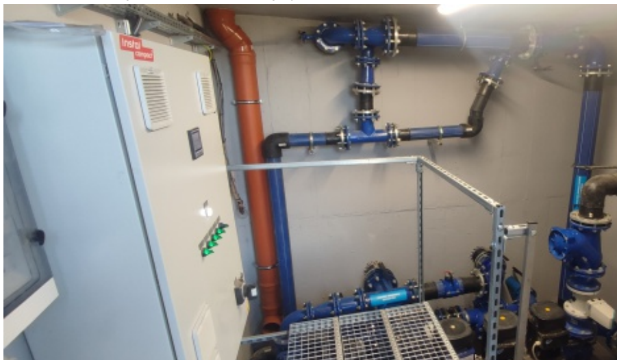
Wodociąg tranzytowy z Marcinkowic do Rdziostowa