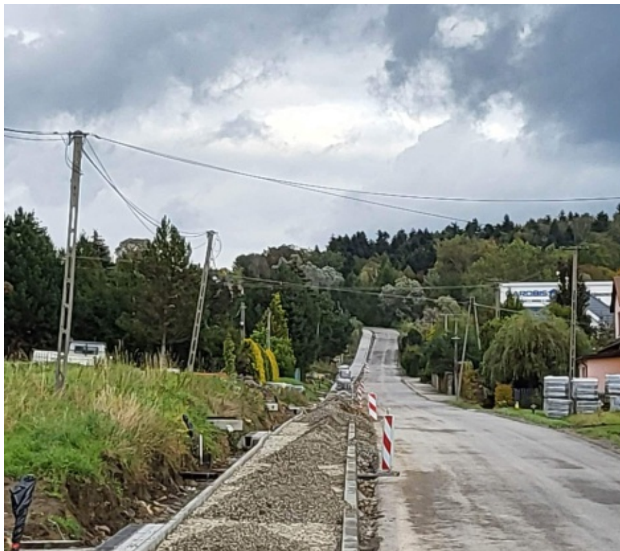
Przebudowa drogi Wielogłowy – Ubiad

Zadanie realizowane jest w trybie „zaprojektuj i wybuduj” przez firmę Transwiertel sp. z o.o. z siedzibą w m. Świdnik. Przedmiotem zamówienia jest zaprojektowanie i wybudowanie zbiornika wody pitnej wraz z infrastrukturą techniczną oraz to-