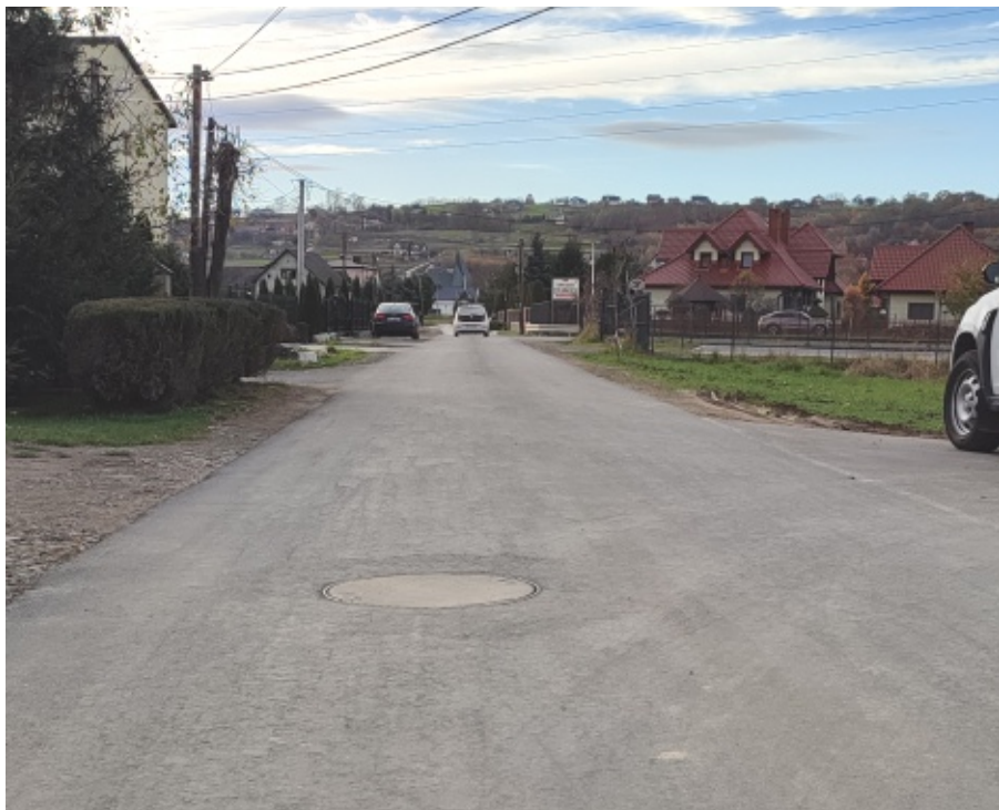
Ulica Łączna w Chełmcu ma już wodociąg i kanalizację