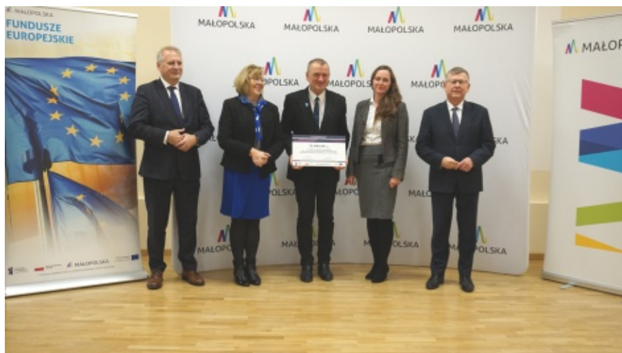
75 tys zł dla chelmieckich szkół