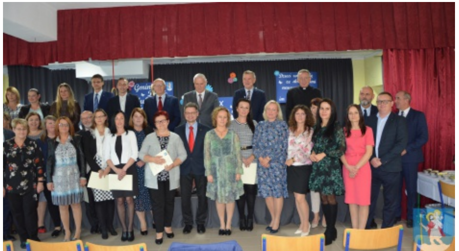
Obchody Dnia Komisji Edukacji Narodowej

do udziału w różnego rodzaju konkursach, olimpiadach, zawodach, gdzie zdobywają wyróżnienia i tytuły, co przynosi gminie dumę. Następnie wójt skierował słowa do wszystkich nauczycieli ze szkół z terenu gminy Chelmiec w tym do nauczycieli ze szkół niepublicznych, dziękując za trud i odpowiedzialność w wychowaniu młodego pokolenia oraz życzył satysfakcji z pracy i wielu sukcesów zawodowych. R.P.