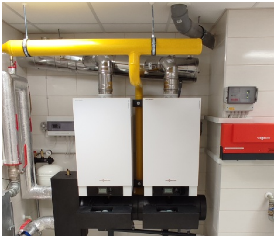
Nowa kotłownia w Librantowej

Zamontowano też systemy detekcji typu GAZEX oraz wykonano roboty budowlane związane z wymianą stolarki, wykonaniem wylewek oraz izolacji przeciwwilgociowych. Całkowity koszt inwestycji to 230 096,37 zł brutto. M.B.