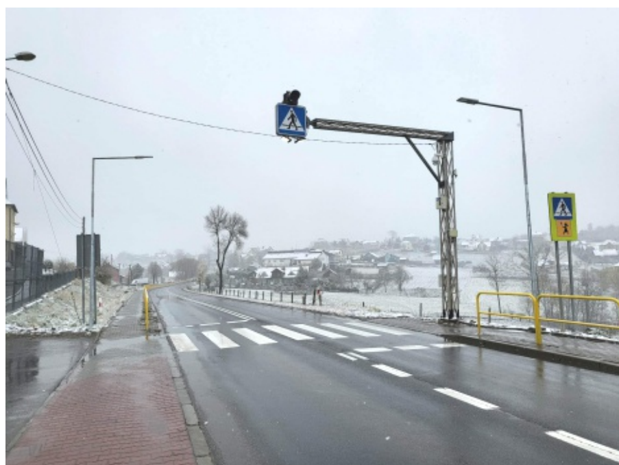
Przeście dla pieszych w miejscowości Trzetrzewina

Łączna długość kanalizacji sanitarnej w miejscowości Biczycze Górne, która zostanie zrealizowana w etapie IV wynosi 3.034,00 mb. Inwestycja zostanie