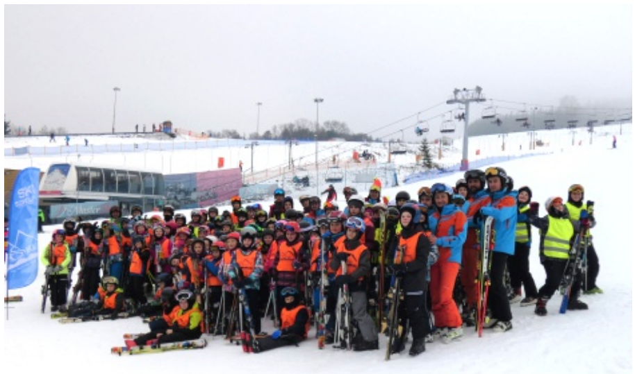
Nauka jazdy na nartach