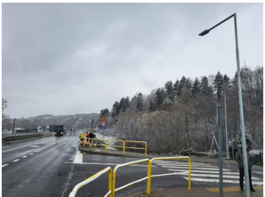
Przejście dla pieszych w miejscowości Paszyn