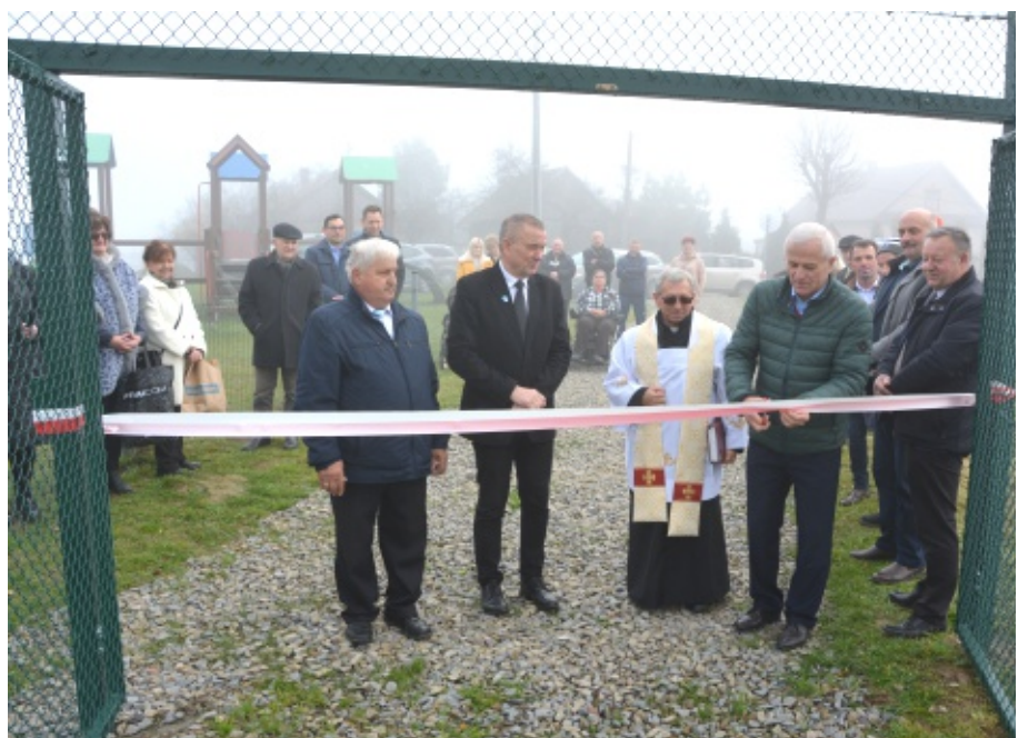
Otwarcie boiska w Biczycach Górnych