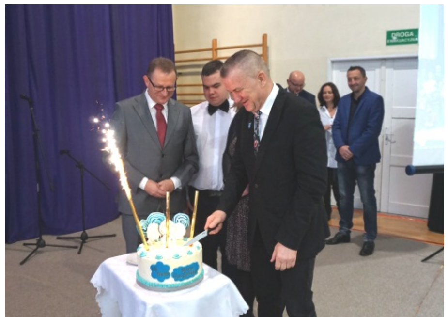
Dziesięciolecie powstania oddziałów specjalnych w Chelmcu