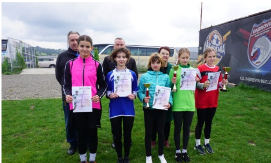
Sztafetowe Biegi Przelajowe