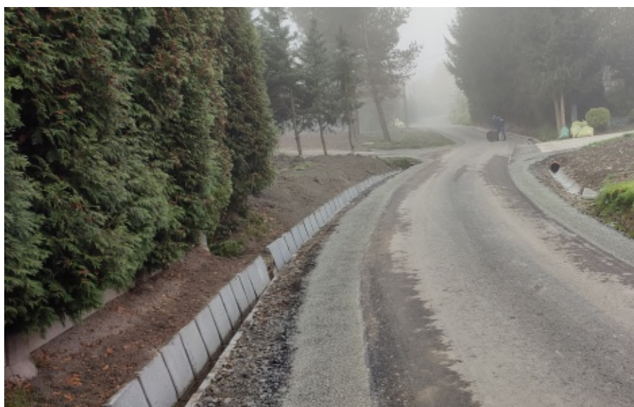
Inwestycje w Marcinkowicach