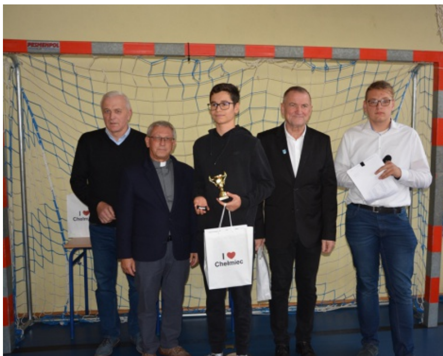
Turniej Szachowy w Trzetrzewinie