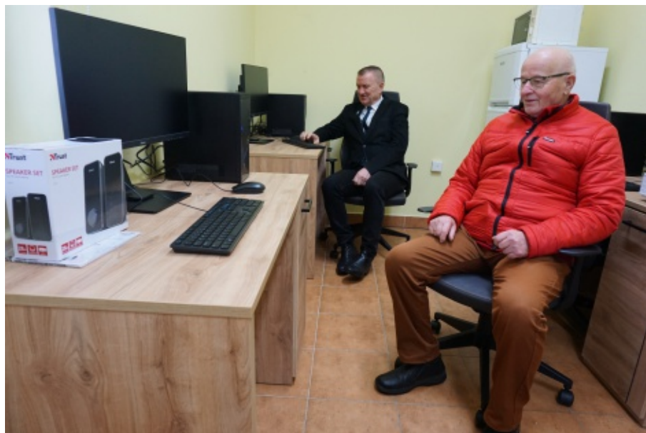
Świetlica w Małej Wsi z nowym wyposażeniem