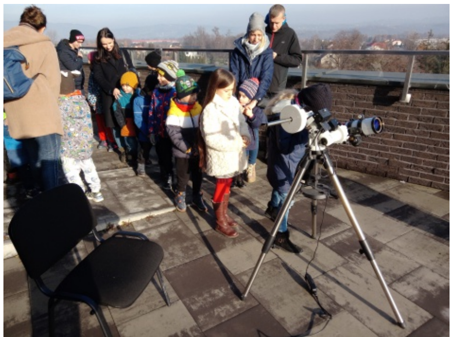
Kosmiczne Mikołajki w Astro Centrum