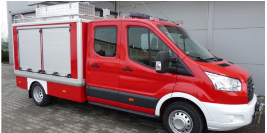
Nowy samochód dla OSP Krasne Potockie

28 gmin z województwa małopolskiego zostało wybranych do realizacji projektu „Bezpieczna Małopolska – samochody ratownicze”, w ramach Priorytetu V Regionalnego Programu Operacyjnego Województwa Małopolskiego na lata 2014-2020 – Działanie 5.1 Adaptacja do zmian klimatu, Poddziałanie 5.1.2 – Wsparcie służb ratunkowych. Wśród wybranych znalazła się także gmina Chełmiec, która złożyła wniosek o zakup nowego lekkiego samochodu ratowniczego z funkcją gaśniczą dla OSP Krasne Potockie. Koszt zakupu pojazdu szacuje się na 350 tys. zł z czego 70% stanowić będzie dotacja z projektu, natomiast pozostałe 30% to wkład własny gminy