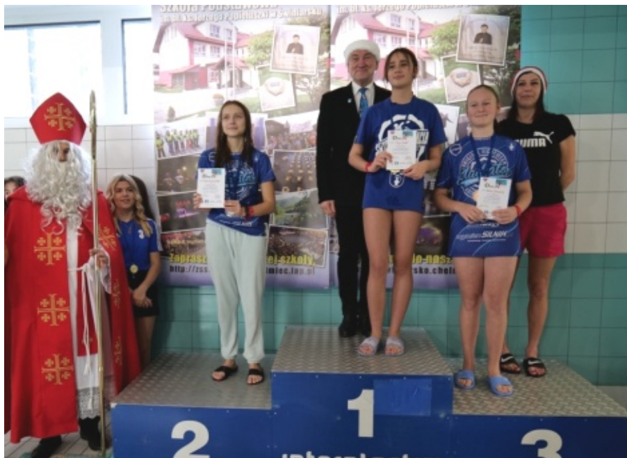
Mikołajkowe zawody pływackie