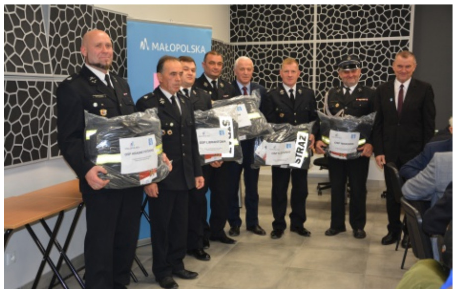
Doposażenie OSP w ramach konkursu "Małopolskie OSP 2022"

W dniu 25 listopada b.r. podczas sesji Rady Gminy Chełmiec zostały przekazane jednostkom OSP z terenu gminy Chełmiec ubrania ochronne do działań bojowych typu RAPTOP NXT. Gmina Chełmiec na ten cel otrzymała dotację z Urzędu Marszałkowskiego Województwa Małopolskiego w ramach programu „Małopolskie OSP 2022”. To efekt złożonego przez gminę wniosku o udzielenie pomocy finansowej na zapewnienie gotowości bojowej jednostkom Ochotniczych Straży Pożarnych z terenu województwa małopolskiego w ramach konkursu „Małopolskie OSP 2022”. Całość zadania wyniosła 16 290 zł w tym dotacja