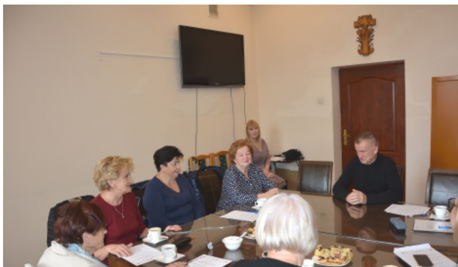
Gminna Rada Seniorów

Podczas posiedzenia omówiono min. organizację obchodów Gminnego Dnia Seniorów oraz bieżącą działalność rady. Przewodniczący poinformował zebranych, że 7 września 2022r.