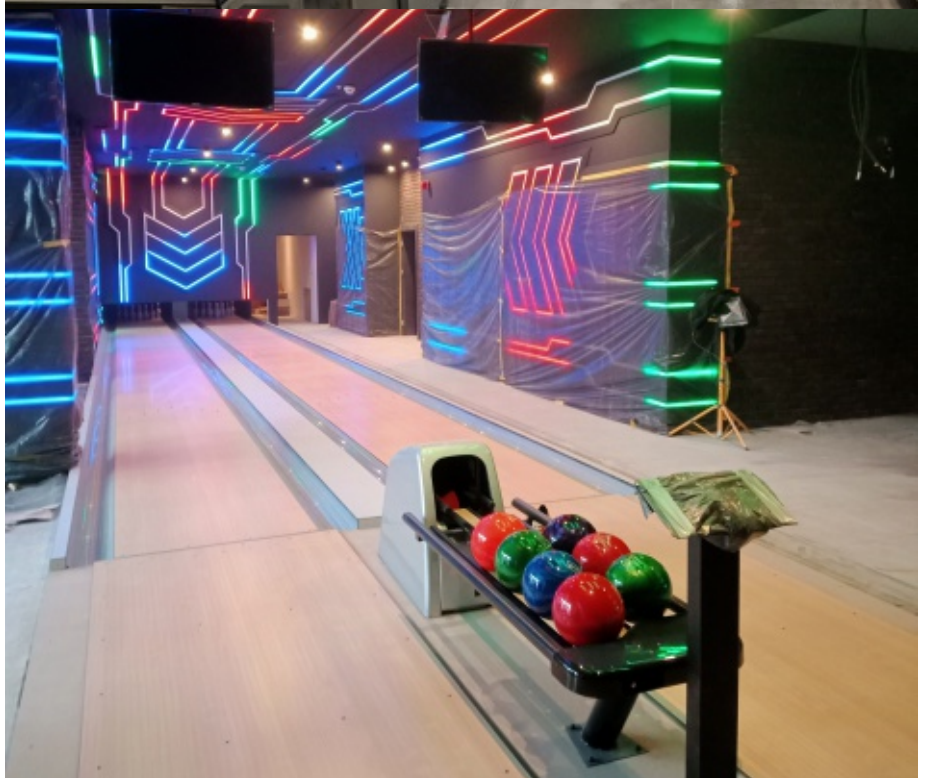
Aranżacja Astro Centrum