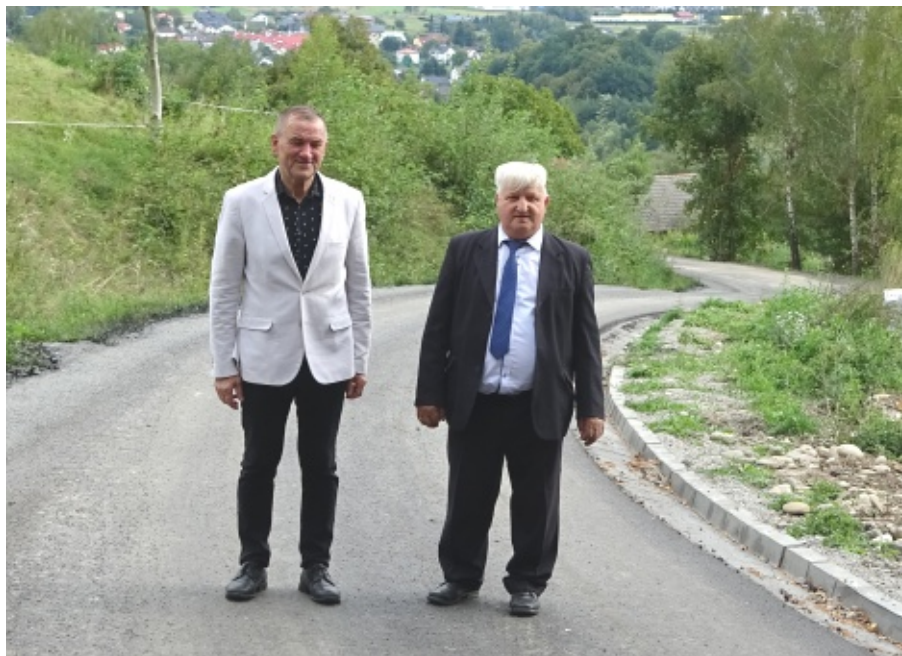
Remont drogi i nowa kanalizacja w Biczycach Górnych

Zakończyła się budowa dużego odcinka nowej sieci kanalizacji sanitarnej w Biczycach Górnych. Nowa sieć o długości ponad 2 km została wykonana wzdłuż całej drogi gminnej „Na Podlesie” wraz z wysięgnikami wzdłuż pobocznych dróg. Jednocześnie podczas budowy została odtworzona nawierzchnia całej drogi w związku z licznymi przekopami. Do nowej sieci kanalizacyjnej będzie mogło się podpiąć ok. 50 gospodarstw domowych. Budowa nowej sieci kanalizacyjnej kosztowała budżet gminy 867 tys. zł, a odtworzenie nawierzchni drogowej 335 tys. zł. M.B.