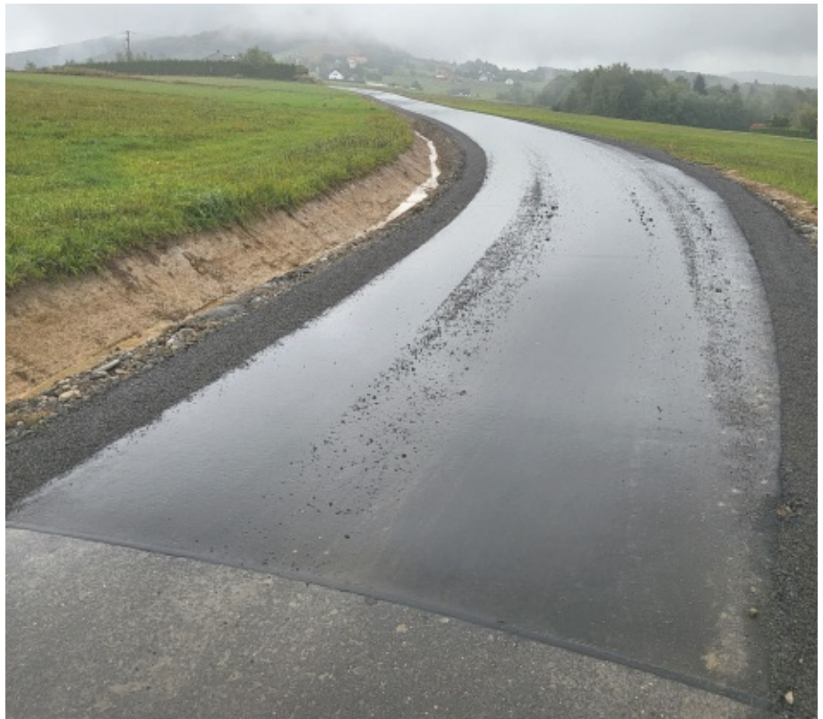
Droga "Ubiad - koło Stadionu" już wyremontowana