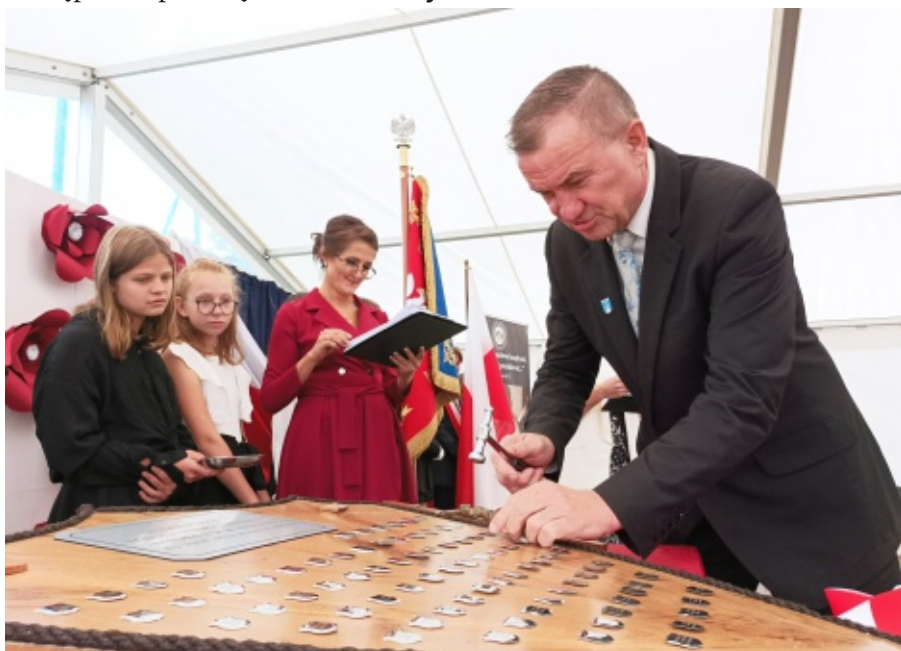
Nadanie imienia Zespołowi Szkolno – Przedszkolnemu w Niskowej