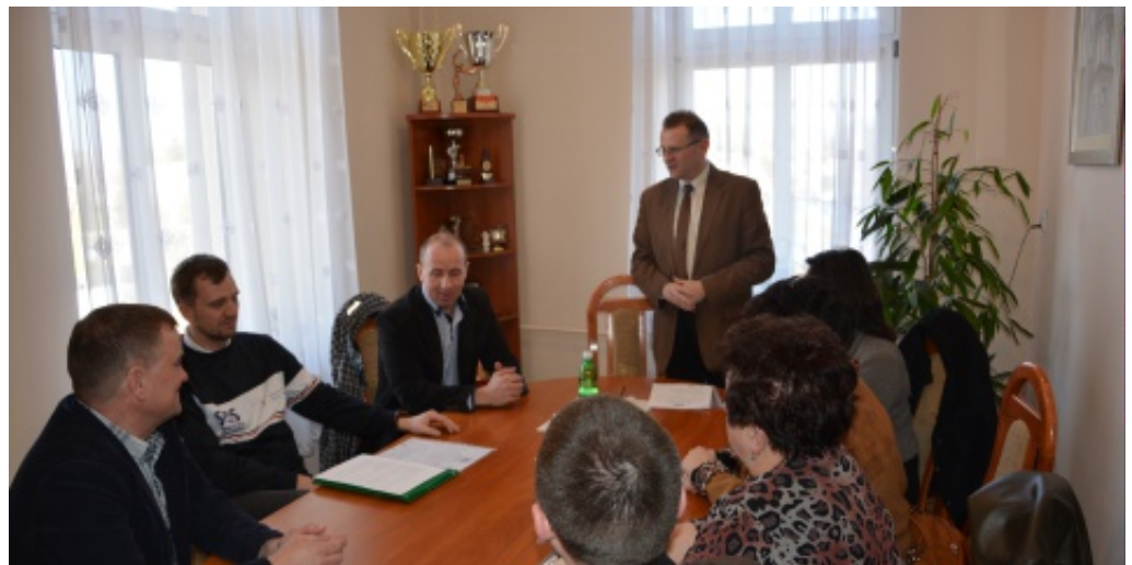
Inauguracja Akademii Siatkarskich Ośrodków Szkolnych.