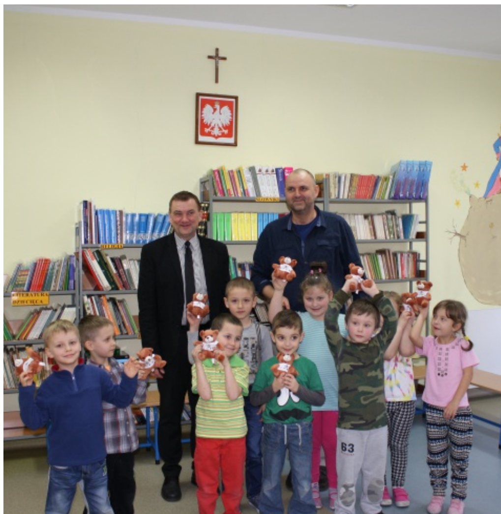
Z pokolenia na pokolenie.