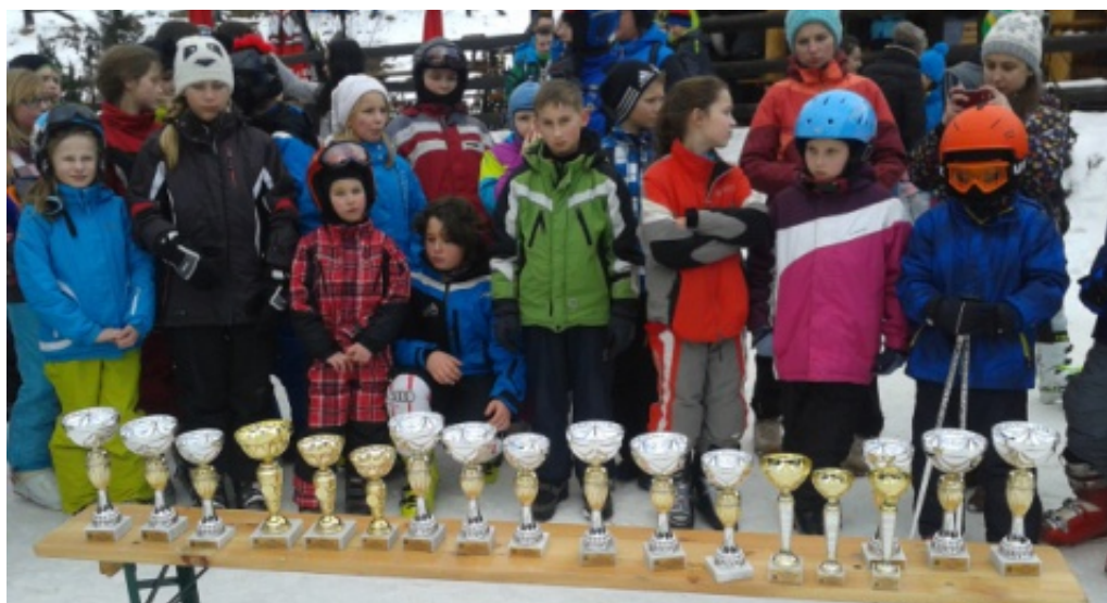
Mistrzostwa gminy w narciarstwie zjazdowym.

Przy pięknej zimowej pogodzie i wspaniałych warunkach śniegowych, na stoku w Cieniawie 30 stycznia 2015r odbyły się Mistrzostwa gminy Chełmiec szkół podstawowych oraz gimnazjów w narciarstwie zjazdowym. Udział w zawodach wzięła rekordowa liczba 101 zawodników i zawodniczek ze szkół z