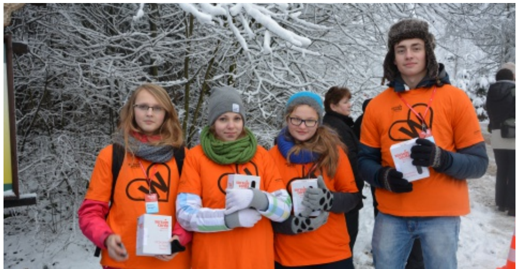
Bieg na Paścią Górę.