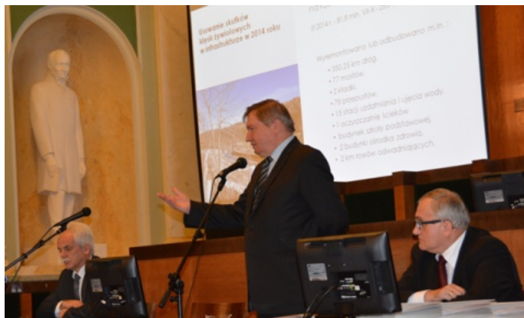
Przekazanie dotacji na chełmieckie drogi.