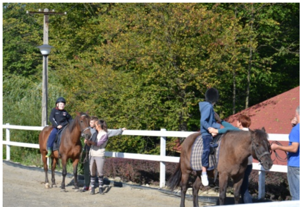
Oddziały specjalne w Chełmcu.