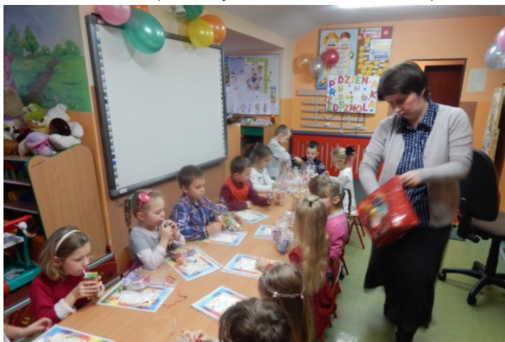
Modernizacja i doposażenie oddziałów przedszkolnych.