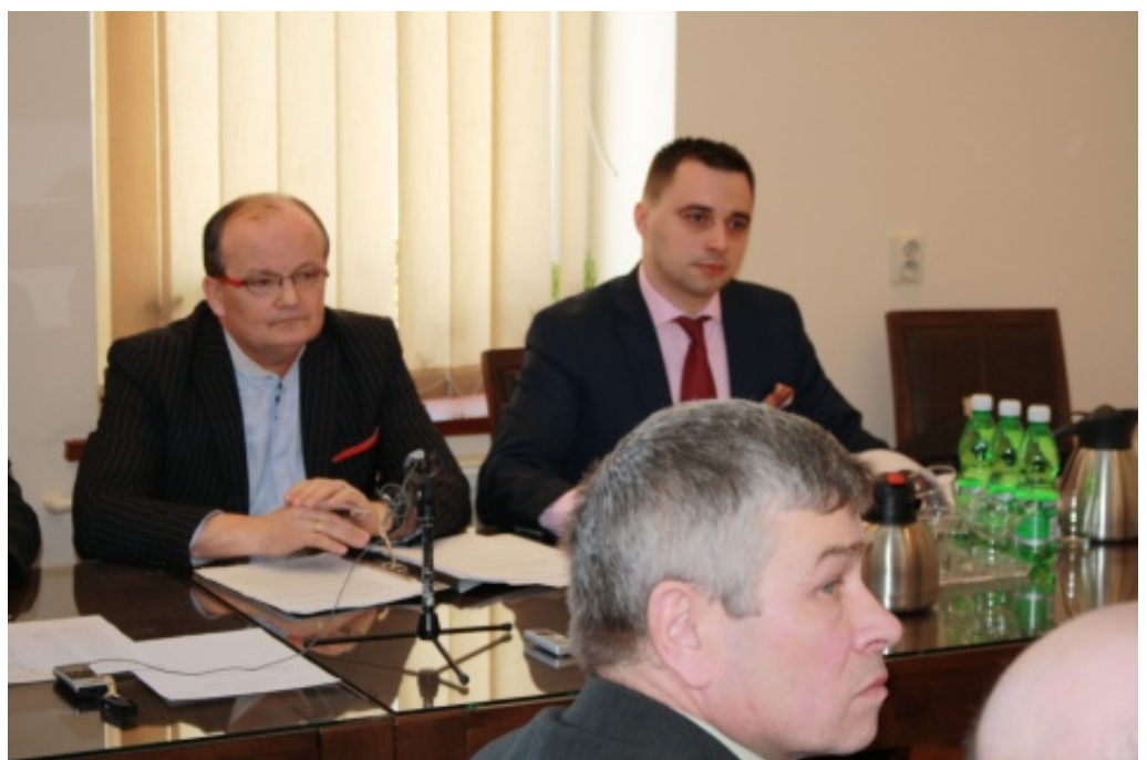
V Sesja Rady Gminy Chelmiec.

ra”, czyli wbrew sobie samemu!. Uchwała przechodzi stosunkiem głosów - a jakże, jak zawsze...11:10. W efekcie pozostaje nam jedynie czekać na uchylene uchwały przez nadzór prawny. Takie zachowania potwierdzałyby tezę o braku merytorycznego przygotowania do pracy w radzie i zabieranie czasu pozostałym radnym, urzędnikom oraz generalnie tezę o angażowaniu innych w sprawy nie związane z sensownymi pracami na rzecz gminy. To prawda, że są złodzieje, którzy nigdy nie podlegają karze - to złodzieje czasu. Tak się kończy zabawa bez odpowiedzialności za decyzje, na koszt podatników. Czyli bezkarnie. A nawet w poczuciu „dobrze spełnionego