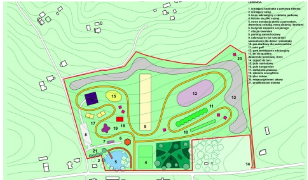
Wstępna koncepcja centrum.