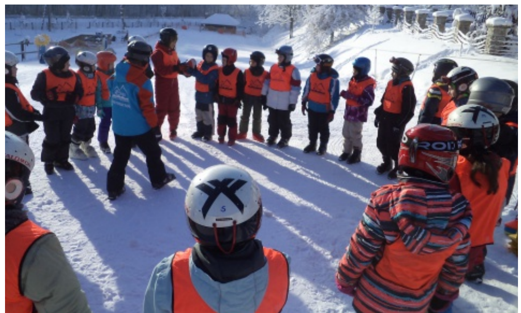
Jeżdżę z głową.

stawowych umiejętności jazdy na nartach, poznawali zasady bezpiecznego korzystania ze stoków narciarskich oraz udzielania pomocy. Nauka jazdy na nartach odbywała się pod okiem instruktorów narciarstwa w czterech grupach. Po każdych trzygodzinnych zajęciach