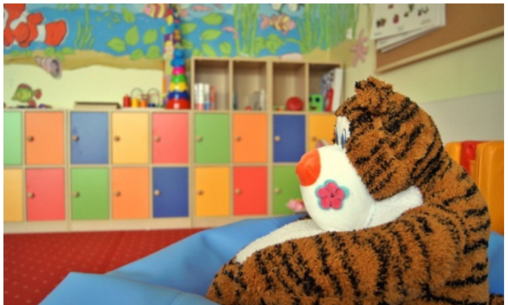
Przedszkole w Biczycach Dolnych.