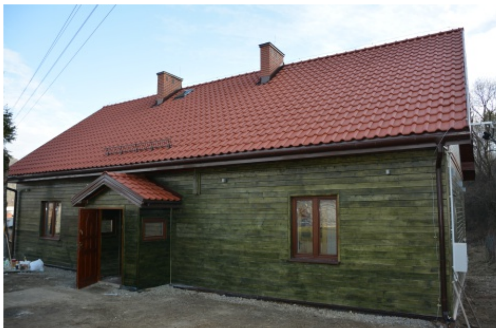
Wyremontowane centrum w Marcinkowicach.