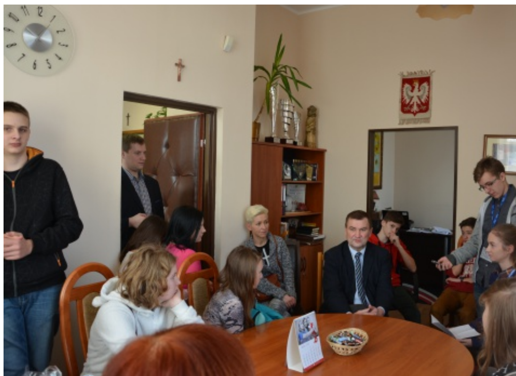
Lekcja obywatelska gimnazjalistów ze Świniarska.

Nowosądeckiego a w przyszłość, może nawet z władzami Sejmiku Województwa Małopolskiego.