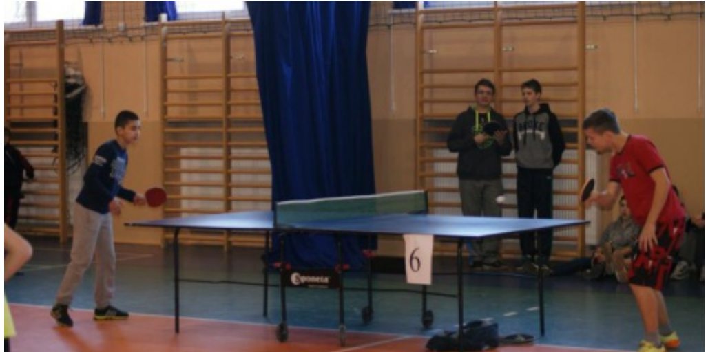
XIV Otwarty turniej tenisa stołowego.

Uczestnicy jak zawsze dopisali. Wśród około 100 zawodników gościliśmy min. WTZ MADA z Nowego Sącza, KS Start Nowy Sącz, uczniów z Gimnazjów w