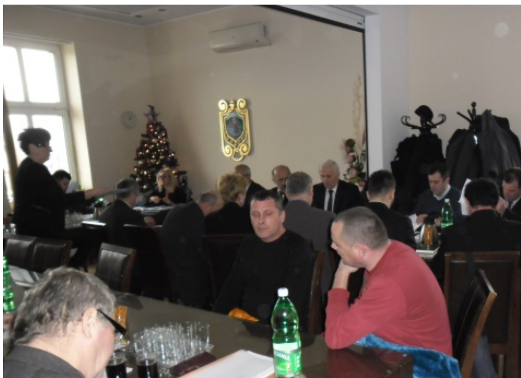
Sesja Budżetowa Rady Gminy Chełmiec.

Ponadto z budżetu gminy na rok 2015 sfinansowana zostanie kontynuacja budowy basenu w Chełmcu, cmentarza w Rdziostowie oraz budowa miejsczeczka rowerowego w Chełmcu, remont ciągu drogowego Cmentarz-Niwy w Trzetrzewinie i Biczycy Górne dofinansowane z dotacji z Narodowego Programu Przebudowy Dróg Lokalnych. Ponadto z budżetu finansowane będą projekty kanalizacji w miejscowościach Ku-