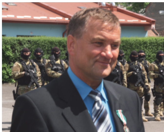
Odznaczenie dla wójta od Ministra Spraw Wewnętrznych.