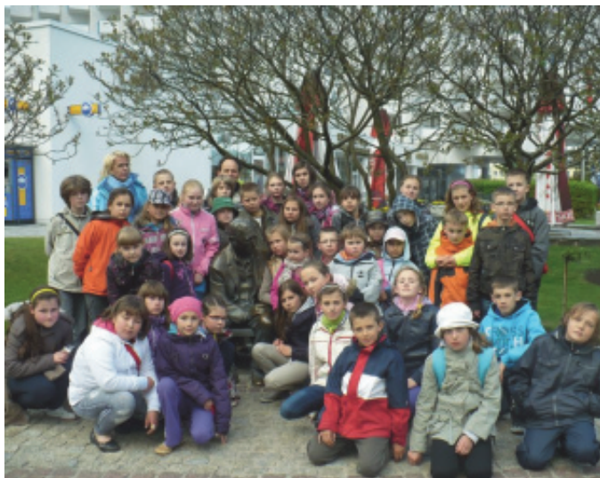
Zielona Szkoła w Świnoujściu.

Tą drogą pragniemy bardzo serdecznie podziękować za wsparcie finansowe tego wielkiego szkolnego przedsięwzięcia: przede wszystkim gminie