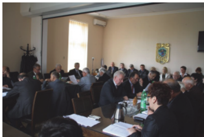
XX sesja Rady Gminy Chełmiec.

ważnień przez radę gminy do dokonywania zmian w budżecie, właściwe gospodarowanie mieniem gminy, pozyskiwanie dodatkowych środków z różnych źródeł na realizację przedsięwzięć inwestycyjno-remontowych w gminie, prawidłowe funkcjonowanie jednostek organizacyjnych gminy. A.B.