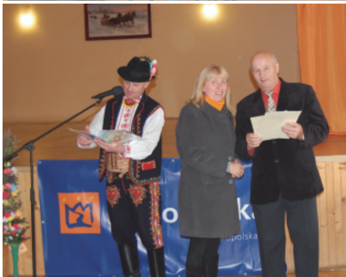
Przegląd palm w Chełmcu.