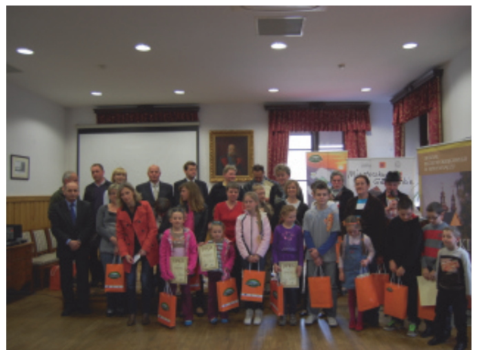
Finał konkursu Palm Wielkanocnych.