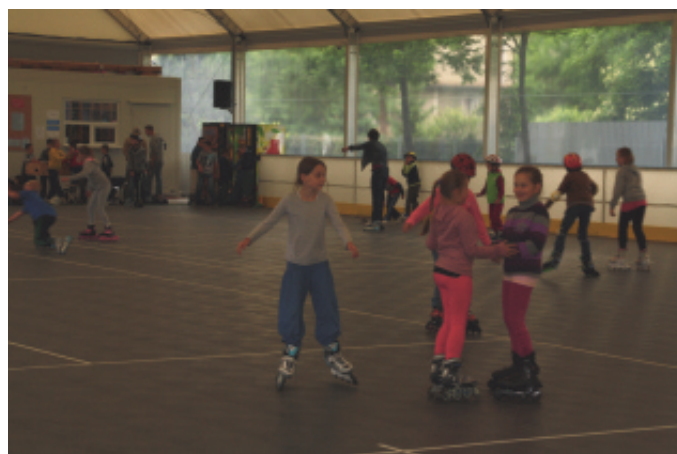
Rolkowisko w Chełmcu.