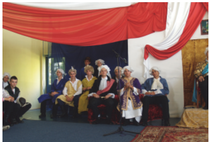
"Witaj majowa jutrzeńko".

10 maja br. swój występ prezentowała grupa Marcinki ze Szkoły Podstawowej w Marcinkowicach, z przedstawieniem pn „Pamiętny maj”. Przed-