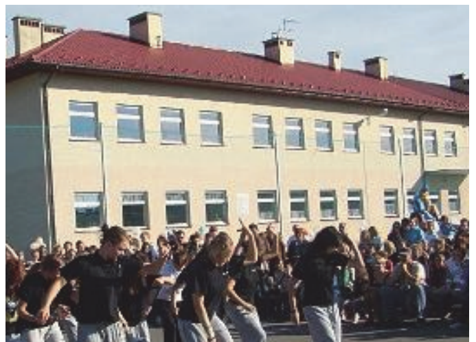
Zespół Szkół w Chełmcu.

uczestniczyli - dzięki współpracy z Fundacją MADA i Szkołą Podstawową nr 6 w Nowym Sączu - w zajęciach ze swoimi autystycznymi rówieśnikami. Szkoła organizowała także spotkania integracyjne, zabawy „okolicznościowe”, czy koncerty noworoczne, połączone ze zbiórką na budowę WIOSKI ŻYCIA dla dorosłych z autyzmem. Stąd też jest to placówka, której uczniom nie jest obca tematyka autyzmu i związanych z tym „kompliakcji”. Ale co najważniejsze jest to szkoła, która nie obawia się uczniów z autyzmem i pragnie przyjąć ich do swojego grona, jako pełnoprawnych członków społeczności uczniowskiej. A.B.