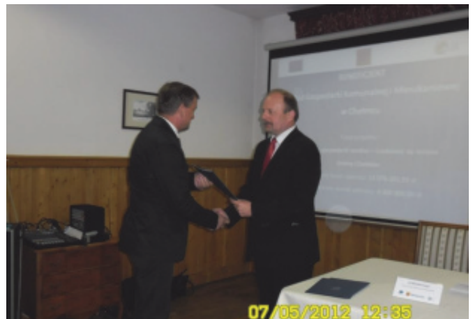
Wręczenie umowy na dotację.