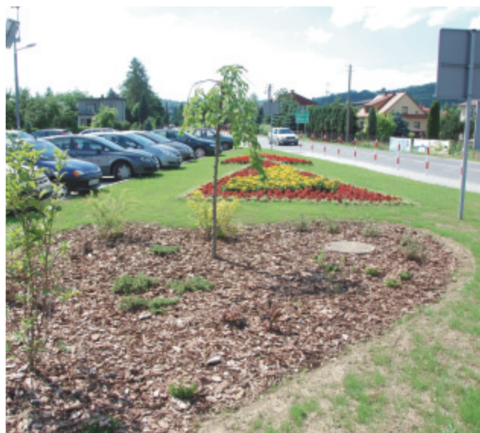
Fontanna i kwiaty przy budynku urzędu.