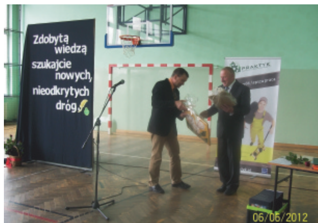
Praktyk – koniec roku szkolnego.