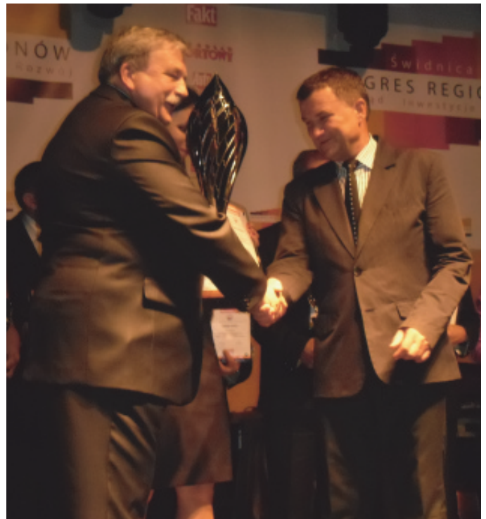
Nagroda dla Gminy Chełmiec.