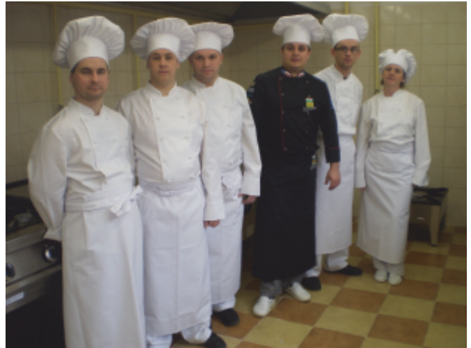
Wręczenie umowy na dotację.

organizacji indywidualnych imprez okolicznościowych, zarówno na terenie obiektu (dysponujemy salą bankietową) jak również w for-