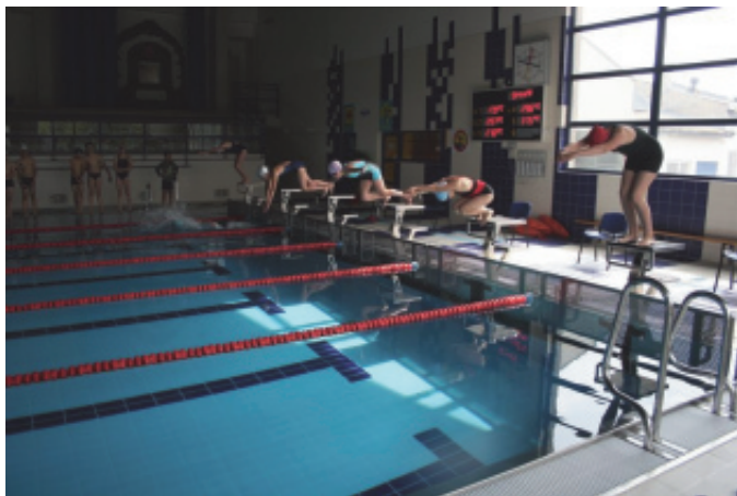
Mistrzostwa Gminy Chełmiec.

„Ekran” i Firma „Bobo”. „Delfin”. Gratulujemy wszystkim uczestnikom i dziękujemy tym, którzy od 10 lat wspierają inicjatywę UKS „Delfin”, podejmowane na rzecz dzieci i młodzieży z terenu Gminy Chełmiec. P.Ł.