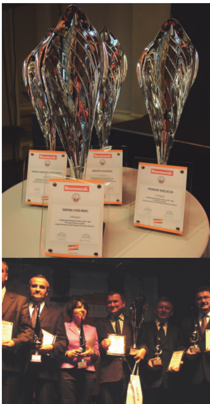
Nagroda dla Gminy Chełmiec.