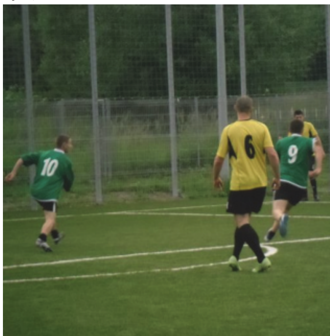
Hortex nowym mistrzem.