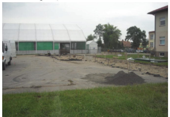
Budowa Orlika w Chelmcu