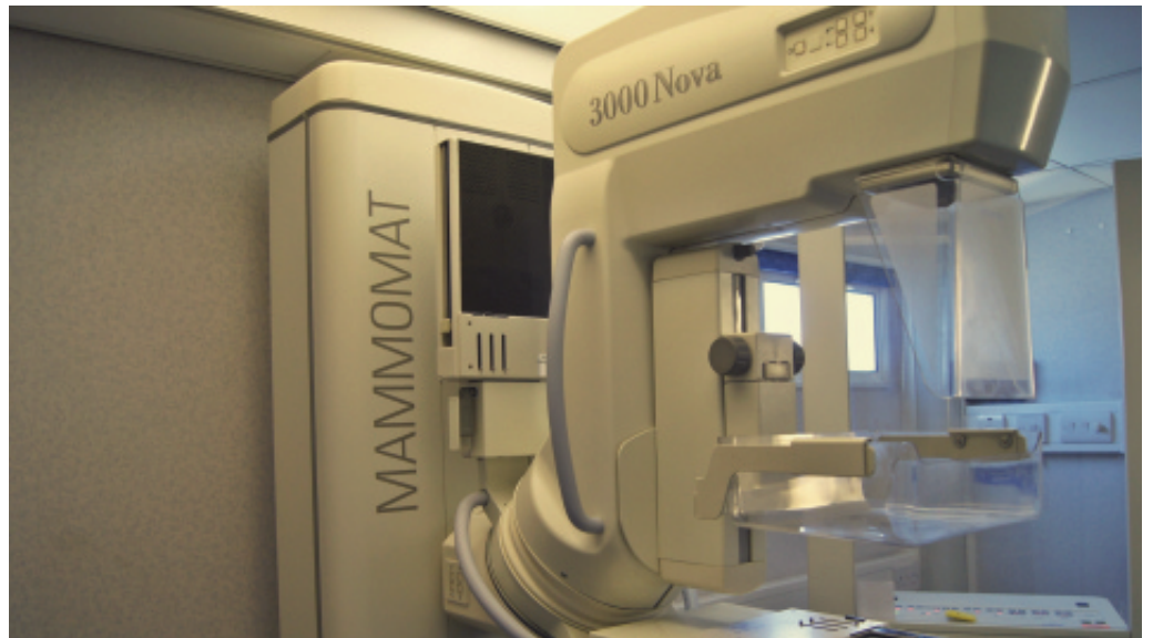
Mammobus przed urzędem gminy.

ekranie komputera, a później przesyłane drogą elektroniczną do analizy. Wszystkie pacjentki, które skorzystały z okazji, aby się przebadac, pełne wyniki otrzymały pocztą. (ra)