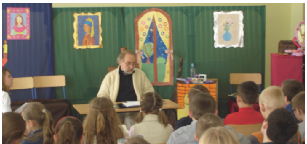
Teatr w Biczycach Dolnych.