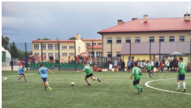
Chełmiecka Liga Orlika.

Pierwszy zjazd przebiegł w formie fazy grupowej oraz play off. Siedem drużyn podzielonych zostało na dwie