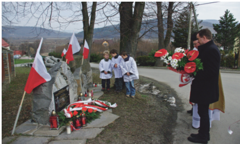
Hołd złożony ofiarom katastrofy smoleńskiej.