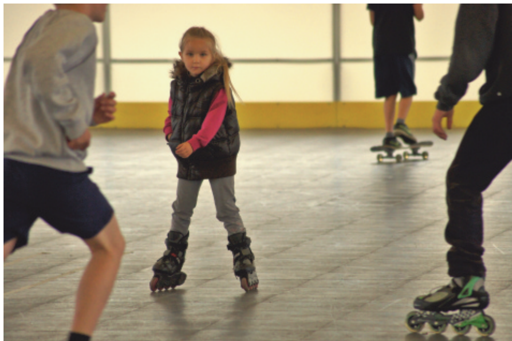
Dzień dziecka w Chełmcu.