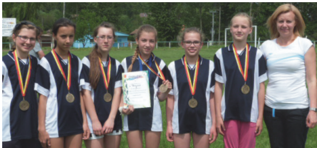
Szkoła z Paszyna mistrzem w czwórboju.