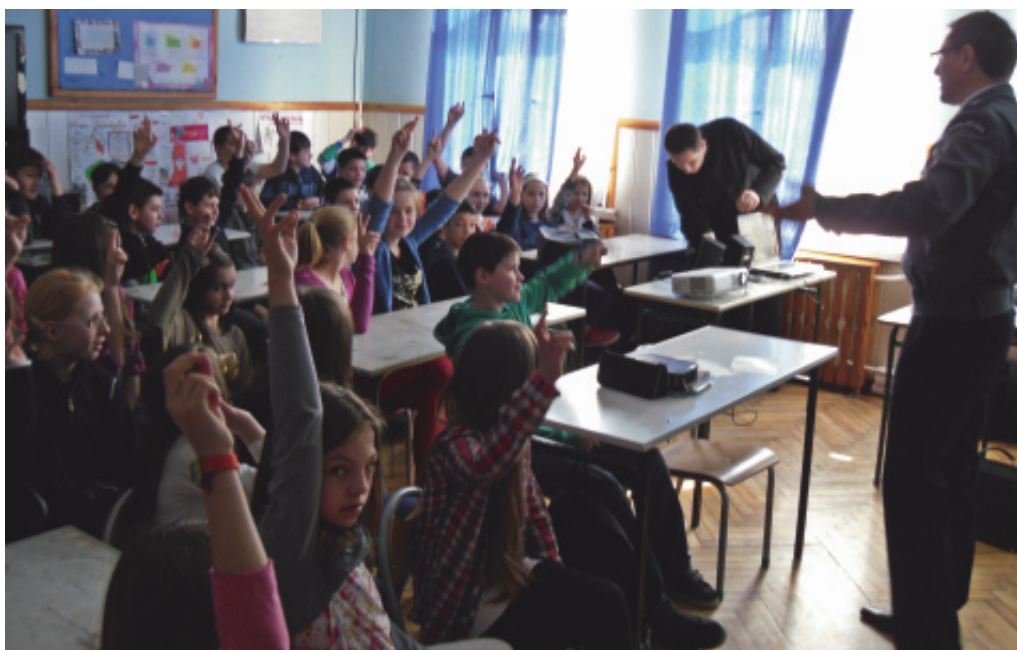
Bezpieczeństwo dziecka w sieci.