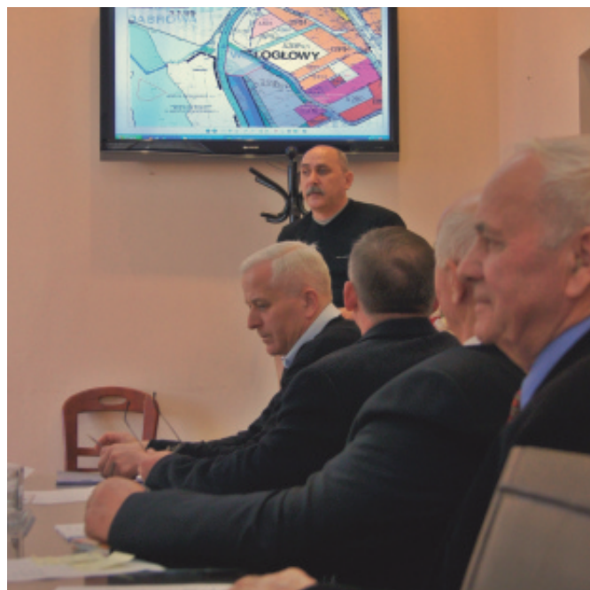
XXX Sesja Rady Gminy.

ścieków w Chełmcu i dowa kanalizacji w Po-Małej Wsi. A na terenie degrodziu i Stadłach. Gminy Podegrodzie bu- Stosowny wniosek