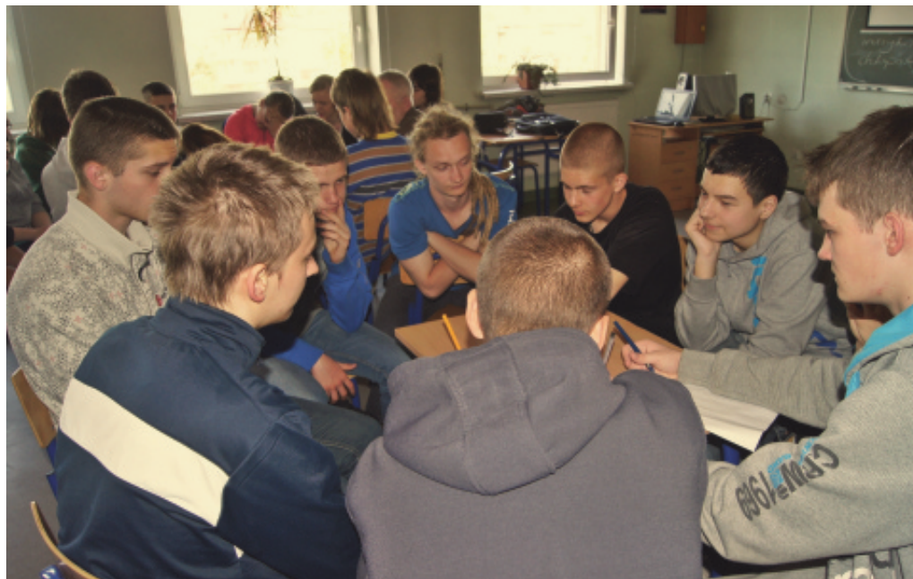
Warsztaty MONARU w Chełmcu.

istotnym elementem warsztatów było uświadomienie młodzieży roli pozytywnego myślenia i samoakceptacji oraz wzbudzenie w nich motywacji do prowadzenia zdrowego stylu życia. (ra)