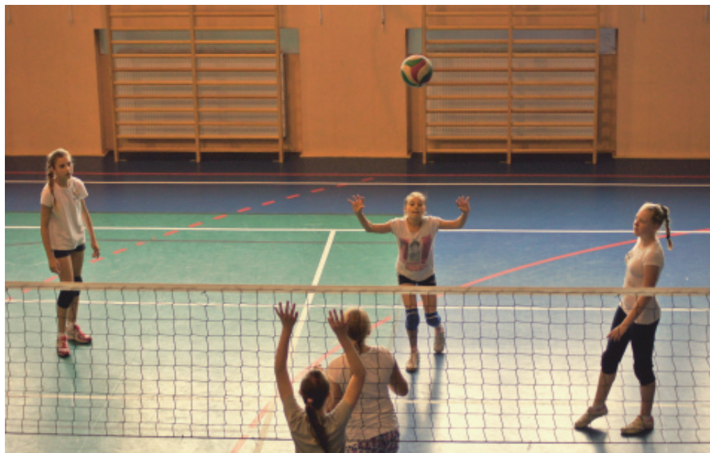
Siatkówka w Świniarsku.