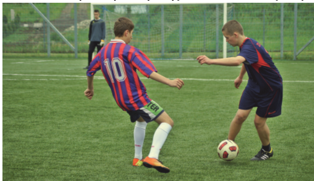
Turniej Piłkarski.

grywce najlepsza okazała drużyna z Wielogłów, która zdobyła 9 pkt i wej. Dwa dni później 23