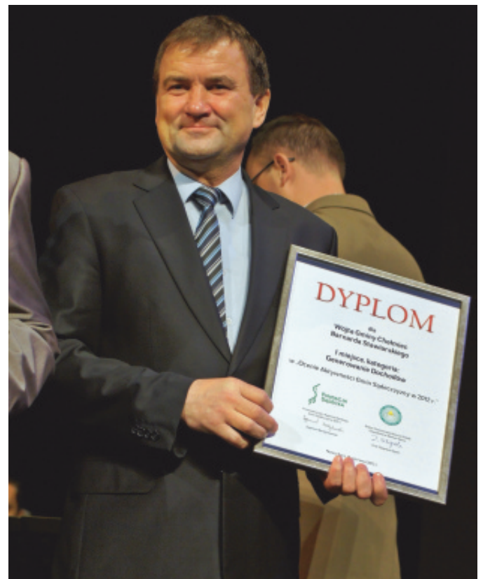
Kolejny sukces gminy Chełmiec.