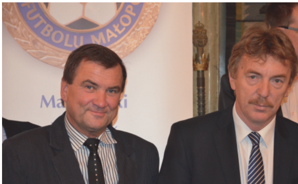
Mecenas Futbolu Małopolskiego.