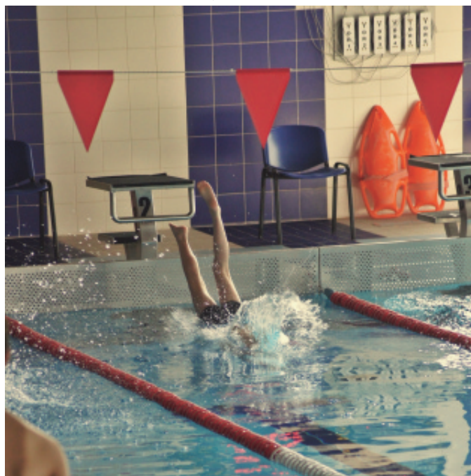
Zawody w pływaniu.

Chełmiec. Rywalizowano w kilku kategoriach wiekowych, natomiast wśród pływaków znalazły się reprezentacje szkół z Rdziostowa, Januszowej, Wielogłów, Librantowej, Chomranic, Chełmca, Biczyc Dolnych, Piątkowej, Marcinkowic, Kłęczan i Świniarska. Na zwycięzców czekały pamiątkowe medale, dyplomy i nagrody rzeczowe. (ra)