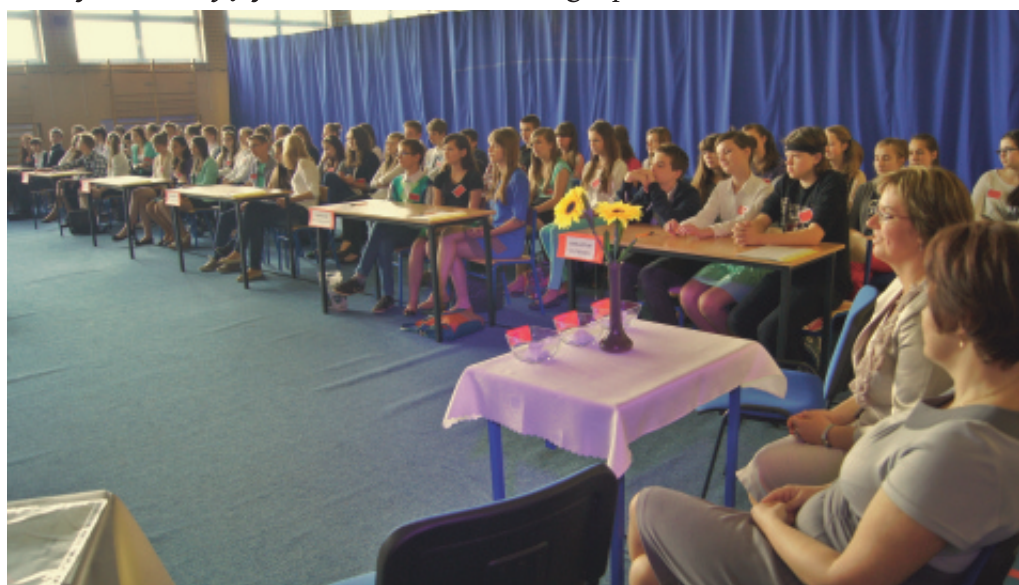
Gminny Dzień Języka Polskiego.