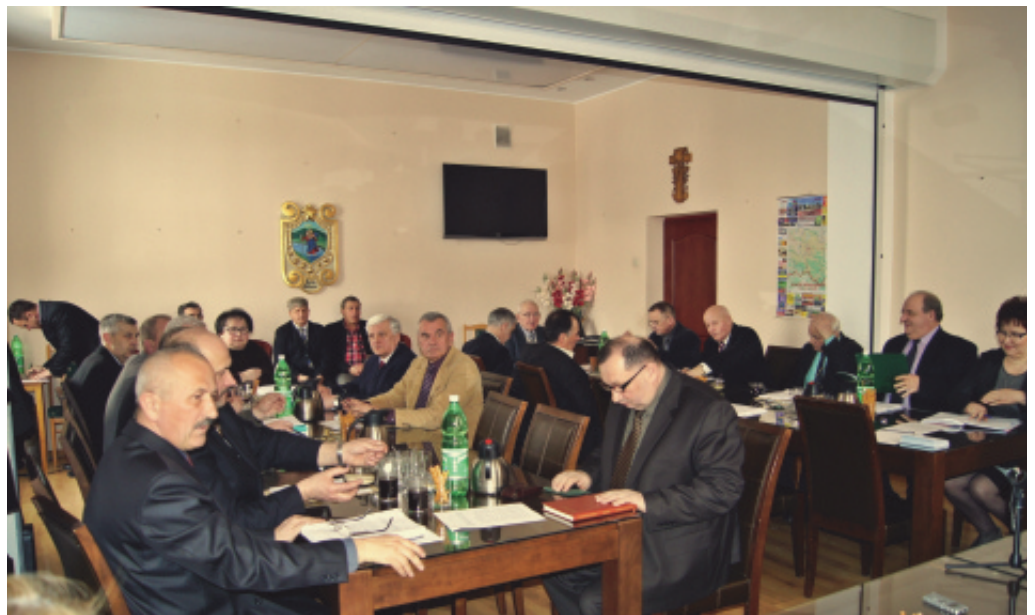
XXVIII sesja Rady Gminy.