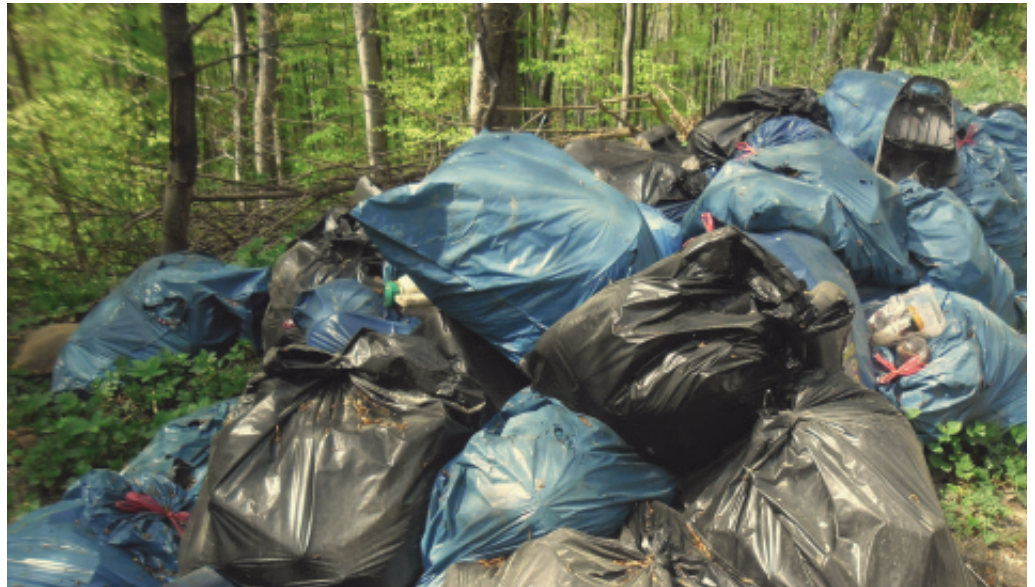
Nielegalne wysypiska śmieci.

Jak wszyscy widzimy wokół siebie zaśmiecony teren jest