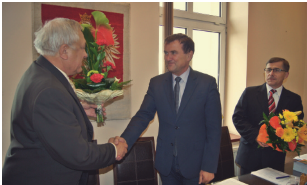
Absolutorium dla wójta.

kie dotacje otrzymało już 200 gospodarstw. Dzięki ostatnim zmianom liczba ta sięgnie blisko 350. Nie byłoby to możliwe bez środków z budżetu gminy. (sza)