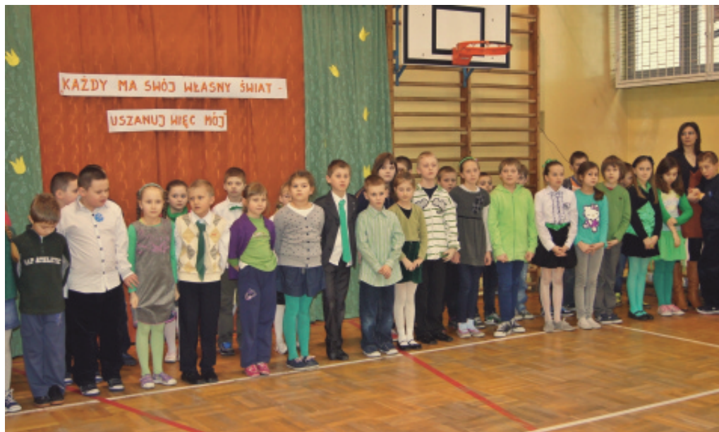
Dzień otwarty w ZS Chełmec.

styczny przygotowany przez uczniów klas I-III oraz uczniów klasy autystycznej, prezentacja osiągnięć uczniów autystycznych i poczęstunek w formie szwedzkiego stołu. (ra)