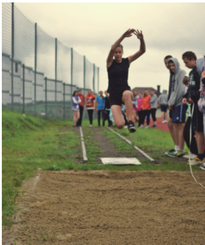
Zawody lekkoatletyczne.