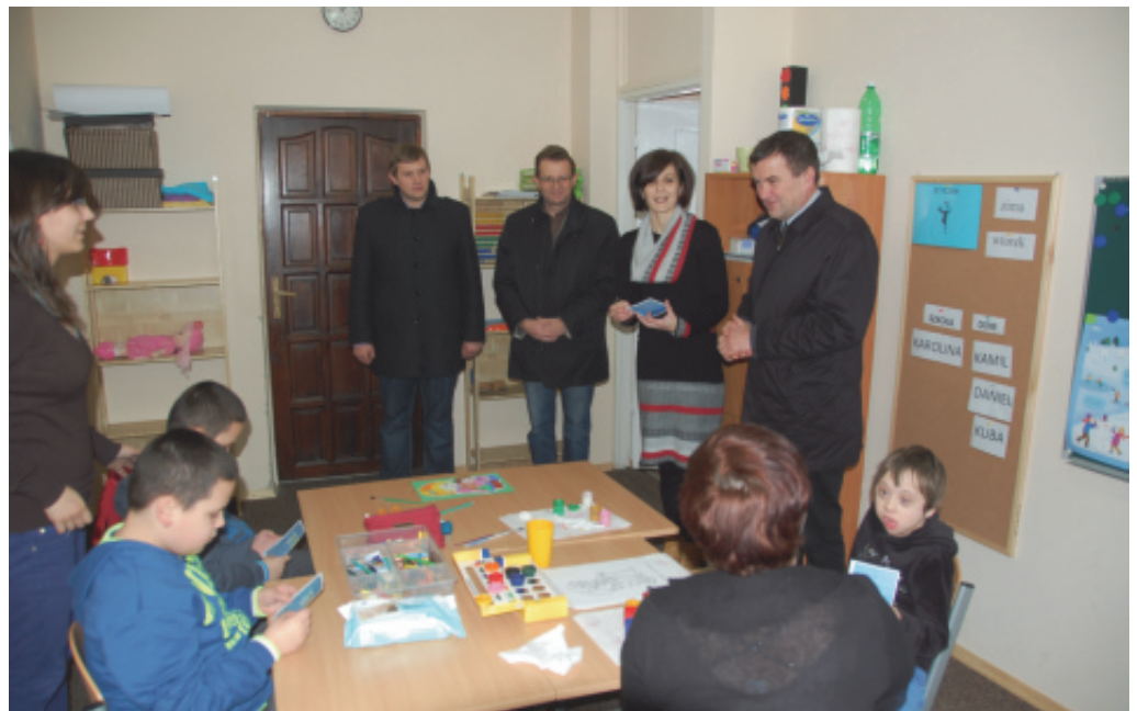
Wizytacja szkoły w Chełmcu.

ny otrzymały od wójta i brało udział 10 drużyn kowic, Piątkowej, Janu- dyrektora szkoły dyplomy oprócz drużyn zwycię- szowej, Klęczan, my oraz pamiątkowe skich również drużyny Rdziosstwa i Wielogłów. puchary. W turnieju z Chomranic, Marcin- K.Z.