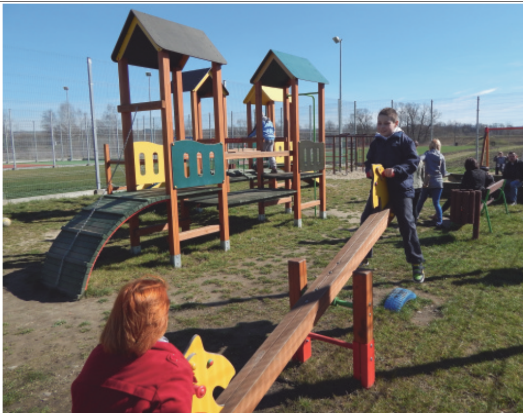
Przywitanie wiosny w Małej Wsi.

Wszyscy bawili się wspólnie, a na twarzach dzieci widniał uśmiech, co jest najlepszym dowodem na to, że odpowiednia opieka i zaangażowanie rodziców i nauczycieli efektuje szczęściem ich podopiecznych. A.T.