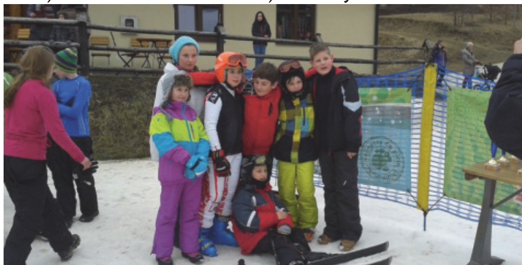
Mistrzostwa Gminy Chełmiec.

Najlepsza trójka zawodników w poszczególnych kategoriach otrzymała pamiątkowe puchary a szóstka dy-