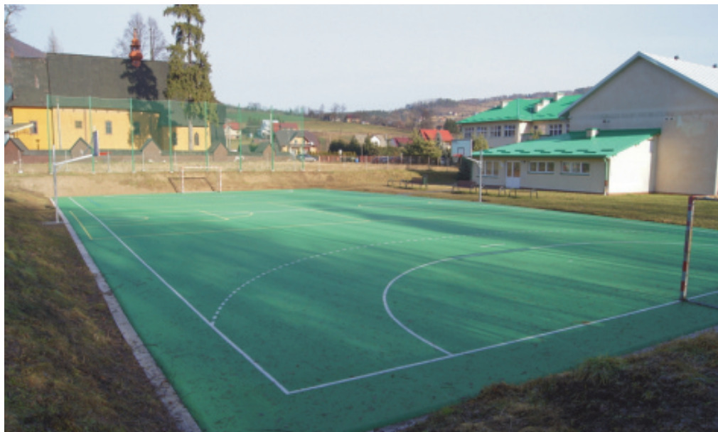
Trzy nowe boiska i chodnik w pół roku

Dzięki dofinansowaniu inwestycji z europejskiego Programu Rozwoju Obszarów Wiejskich na istniejącym boisku sportowym w Chomranicach pojawiła się nowa nawierzchnia i urządzenia do gier zespołowych, wybudowano od podstaw dwa ogrodzone i w pełni wyposażone bo-