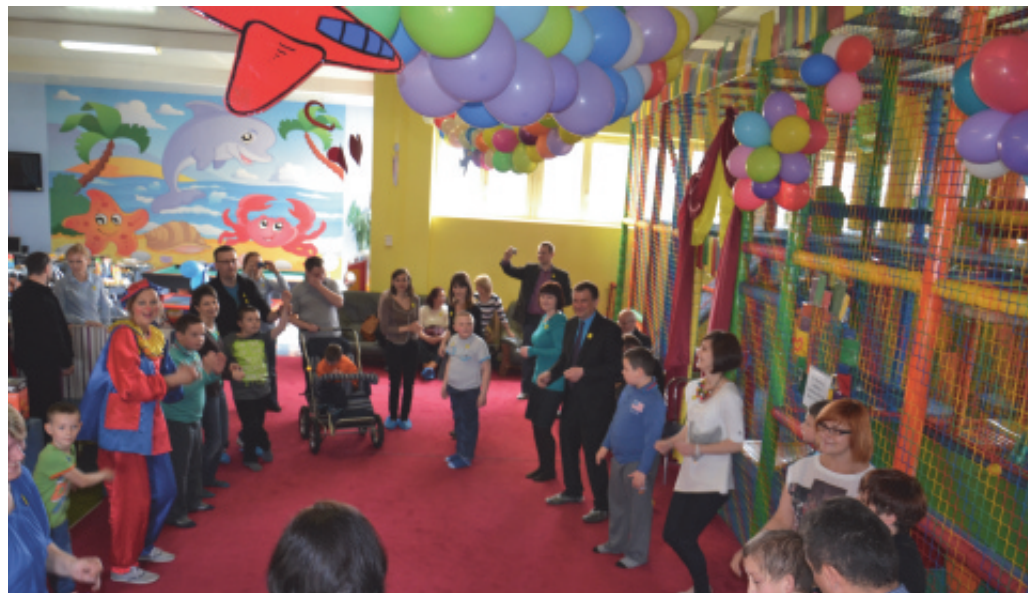
Dzień Wiedzy na Temat Autyzmu.