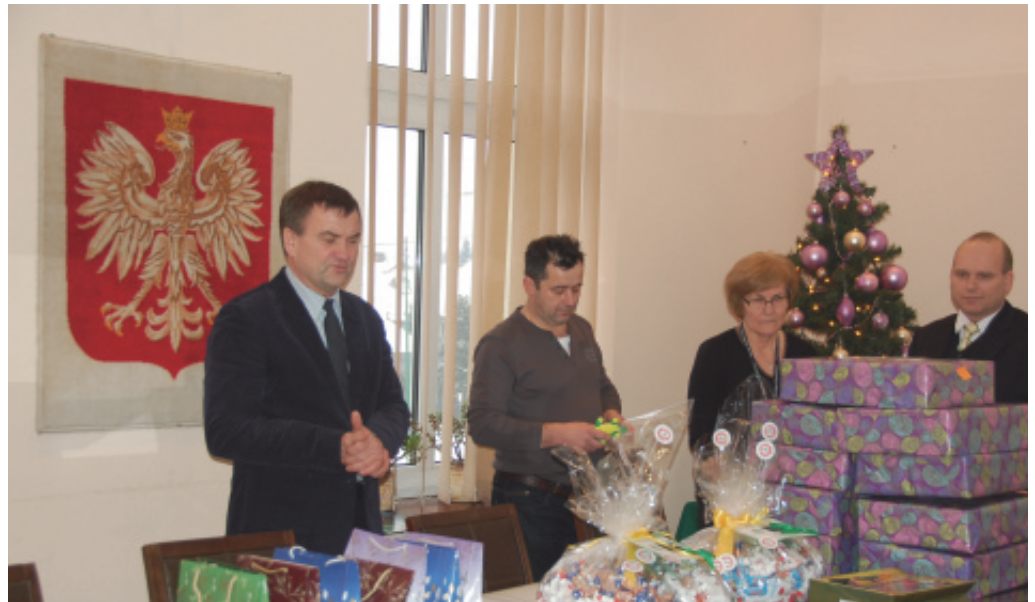
No PROMIL – NO PROBLEM.

Gmina Chełmiec już po raz piąty przystąpiła do kampanii społecznej Trzeźwa Małopolska „NO PROMIL – NO PROBLEM” organizowanej przez Stowarzyszenie Inicjatyw Społecznych „Solny Gwarek” z siedzibą w